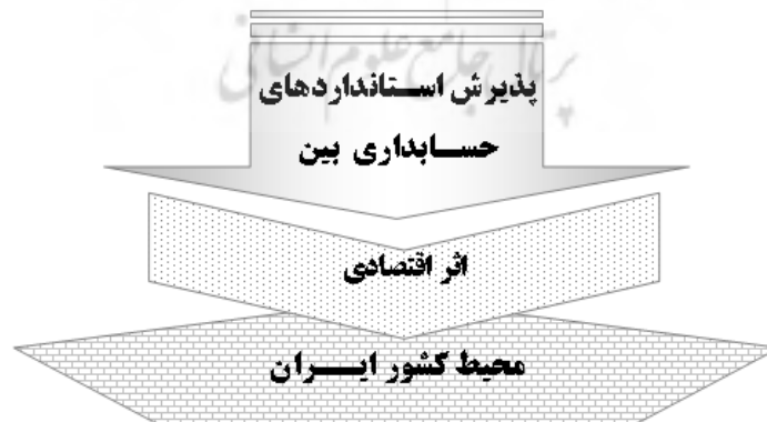
شکل ۱: ارتباط میان متغیرهای پژوهش

در پژوهش حاضر تأثیر پذیرش استانداردهای حسابداری بین‌المللی به عنوان متغیر مستقل بر بعد اقتصادی محیط ایران، به عنوان متغیر وابسته مورد تجزیه و تحلیل و بحث قرار گرفته است. ارتباط میان متغیرهای این پژوهش در شکل ۱ نشان داده می‌شود: