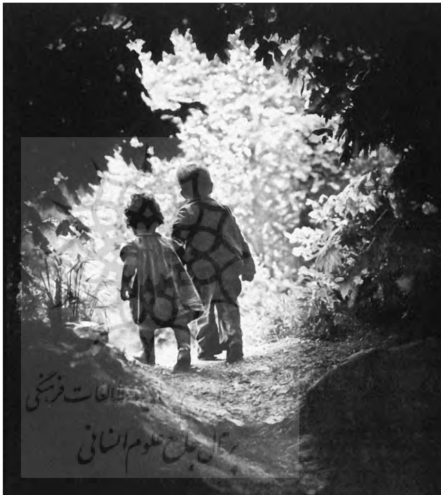
«دالان بهشت»

اما حالا فرض می‌کنیم که یک اصل موضوعی و انتظارات و تعریفی هم به طور کلی از دین داریم. آن بحث را مفروع عنه می‌گیریم و می‌خواهیم ببینیم همین چیزی که عرفاً در جامعه به آن دین می‌گویند، این اصلاً چه کارکردی دارد یا باید داشته باشد؟ یک عده ممکن است بگویند این در حوزه تخصص علوم اجتماعی یا علوم روان‌شناسی و تربیتی است و دین متکفل یک سری مسائل فردی است و نباید در این زمینه دخالت داده شود. این نظریه، بعد از قرون وسطی طرفداران زیادی پیدا کرد. به دلیل افراطی که کلیسا داشت و می‌خواست به همه جا چنگ بیندازد و همه چیز را در تسلط خودش بگیرد، از سیاست و علم و دانشگاه و لابراتوار و بیمارستان و غیره، این افراط باعث آن تفریطی شد که کلاً همه چیز را کنار زدند و گفتند اگر کسی می‌خواهد دین داشته باشد، یک‌شنبه‌ها برود کلیسا و