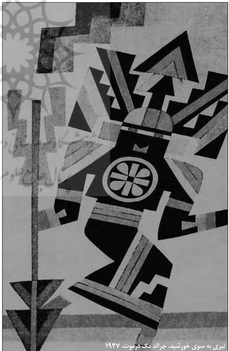
تبری به سوی خورشید، جerald مک درموت، ۱۹۴۷