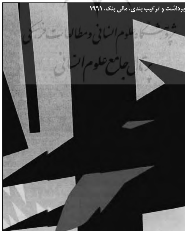
برداشت و ترکیب بندی، مالی بنگ، ۱۹۹۱