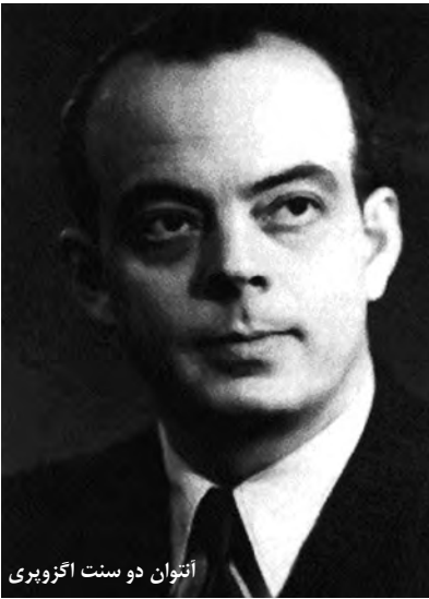
اتنوار دو سنت آگزوپری