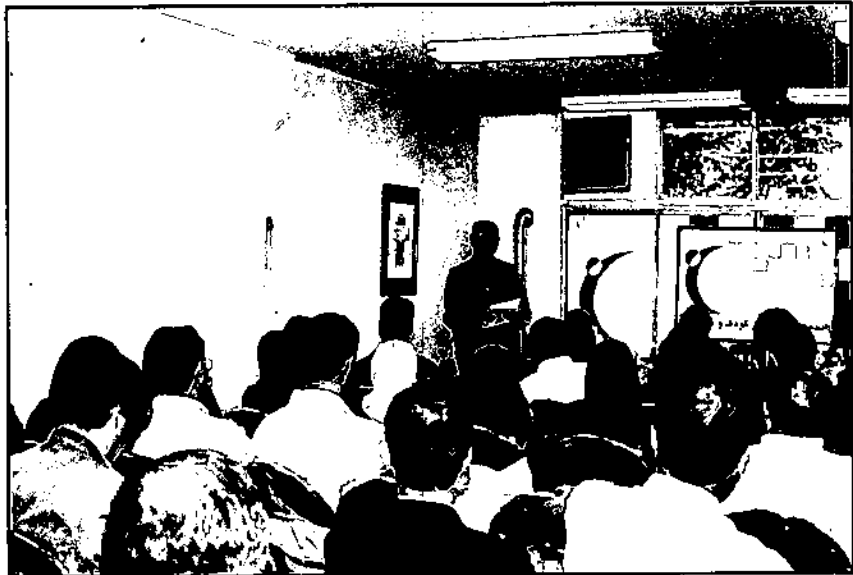
معمل مانده است.

استخدام کارمند جدید و رسیدگی به امور پرسنلی. پی‌گیری ثبت تغییرات هیات‌مدیره، بازرسان و محل