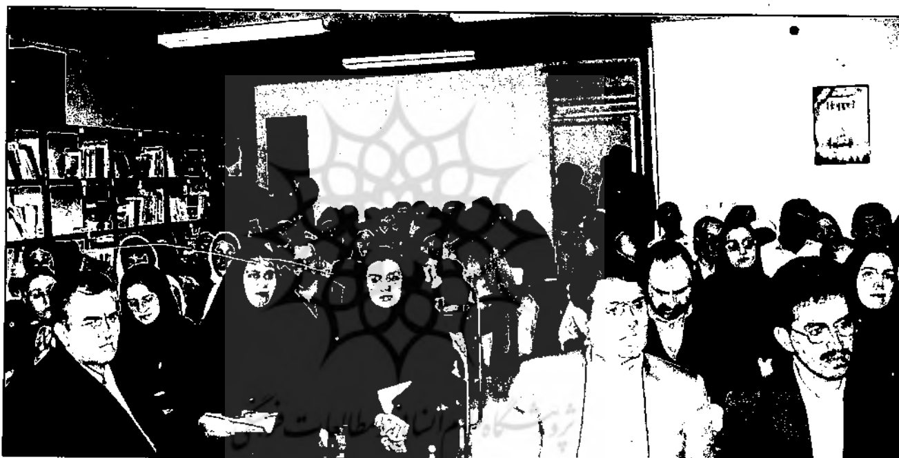
کتابخانه کودک و نوجوان/ خرداد ۸۱

به دلیل پرسش‌هایی که بازرسان قبلی، در سال گذشته مطرح کرده بودند، اسناد مالی انجمن، در اختیار بازرسان جدید قرار گرفت و آنان پس از گفت‌وگو با بازرسان قبلی و نیز بررسی کلیه اسناد مالی انجمن، در گزارشی مکتوب، اعلام کردند که در گردش مالی انجمن ابهامی وجود ندارد و آن را تأیید کردند.