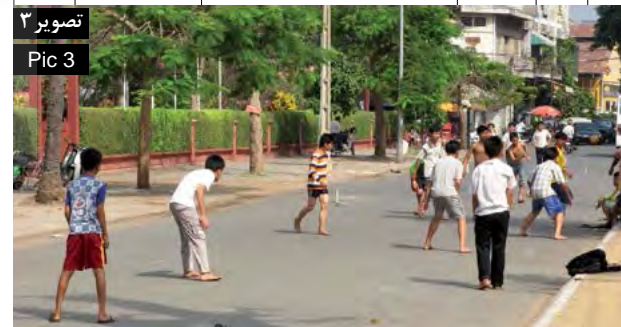
تصویر ۳: محیط کوچه‌ها و خیابان‌ها که به عنوان فضاهای بازی غیررسمی تلقی می‌شوند، با فراهم آوردن امکان تعامل گروه همسالان با اجتماع پیرامون در محلی نه چندان دور از محل زندگی، نقش مهمی در رشد ذهنی، شناختی و ساختار اجتماعی کودکان دارد.