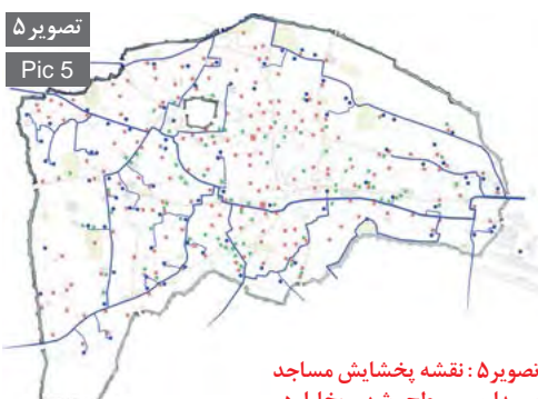
تصویر ۵ Pic 5

تصویر ۵: نقشه پخشایش مساجد و مدارس سطح شهر بخارا در ارتباط با شبکه آبی بخارا قرن ۱۶ برگرفته از نقشه ۱۸۷۲. Pic5: Plan pervades of mosques and school in Bukhara in association with Bukhara water system 16th century AD from plan of 1872.