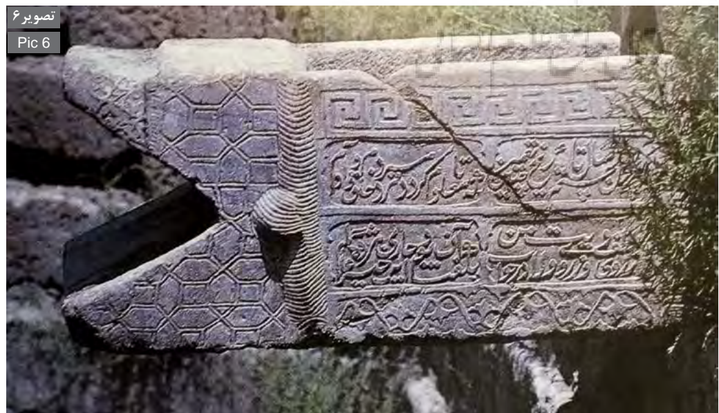
تصویر ۶ Pic 6

به علاوه فضای اطراف حوض‌ها محلی برای تفریح، استراحت، سرگرمی و اجتماع مردم بوده است، چنانچه در مورد لب‌حوض دیوان‌بیگی چنین آمده است: "لب حوض دیوان‌بیگی مانند ریگستان فضای بسیار شلوغ و سرزنده‌ای است. مردم یکدیگر را هل می‌دهند، فریاد می‌کشند، گریه‌واری می‌کنند و تراس‌های سنگی زمین بازی مورد علاقه بچه‌ها و صحنه نمایشی برای دلقک‌ها و