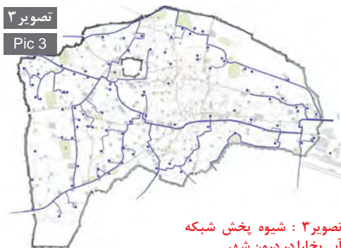
تصویر ۳ Pic 3

تصویر ۳: شیوه پخش شبکه آبی بخارا در درون شهر. Pic3: Pervade method Bukhara water system inside the city.