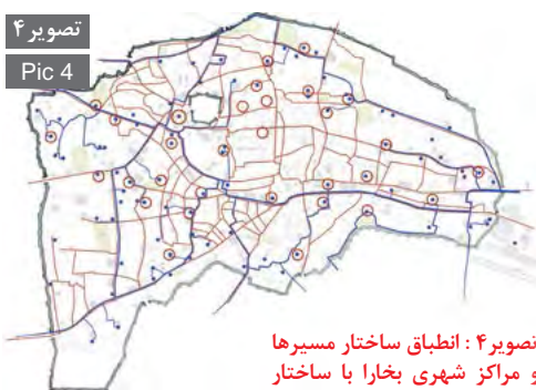
تصویر ۴ Pic 4

تصویر ۴: انطباق ساختار مسیرها و مراکز شهری بخارا با ساختار شبکه آبی بخارا متشکل از نهرها و حوض‌ها. Pic4: Compliance between directions and urban centers of Bukhara and Bukhara water system including streams and ponds.