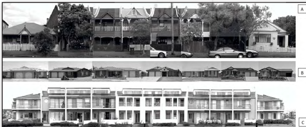
تصویر ۱: سیمای خیابان A، B و C. Tucker, et al, 2005

عکس‌ها بیشترین کاربرد را در تحلیل‌های بصری شهر دارند. البته در بسیاری از موارد لازم است برای تحلیل‌های بصری ترکیبی از