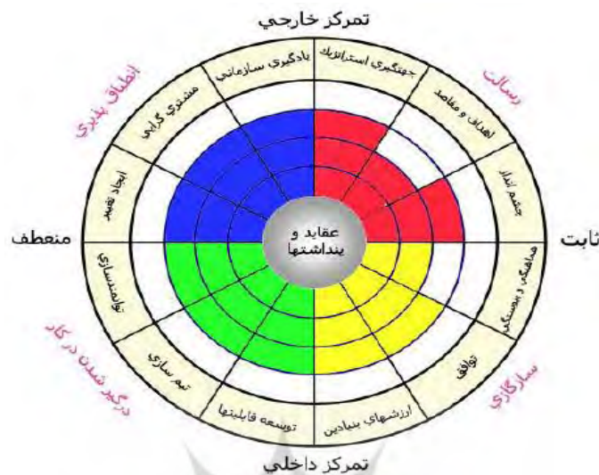
شکل شماره ۱: الگوی مدل دنیسون

سؤال اساسی پژوهش: سؤال اساسی پژوهش این است که فرهنگ سازمانی دانشگاه افسری امام علی (ع) بر اساس مدل دنیسون چگونه است؟ با طرح این پرسش و بر اساس متغیرهای مدل، ۱۵ فرضیه (۴ فرضیه اصلی و ۱۱ فرضیه فرعی) طرح شده است که در بخش تحلیل داده‌ها آمده است.