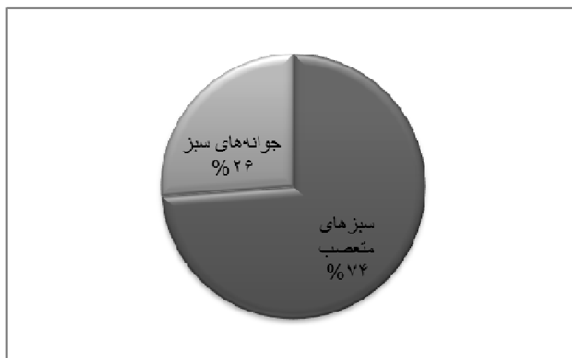
شکل ۲- بخش بندی گروه‌های مصرف کننده