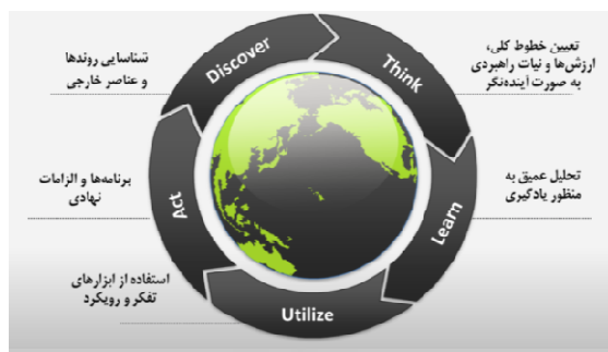
شکل ۴ فرایند پنج مرحله‌ای مستخرج از مدل راهبردی (محقق)

در واقع این فرایند را می‌توان در ۵ لغت Discover, Think, Learn, Utilize, Act خلاصه کرد.