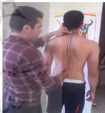
شکل ۱. اندازه‌گیری زاویه سر به جلو

پس از علامت‌گذاری خط‌کش منعطف، بدون تغییر شکل به صفحه شطرنجی انتقال یافت و با مازیک معمولی قوس بین دو علامت ترسیم شد (روایی این روش ۹۰٪ گزارش شده است) (۳۶). دو انتهای هر انحنا با خطی به