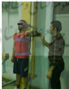
شکل ۳. ارزیابی دامنه حرکتی مفصل شانه

برای ارزیابی دامنه حرکتی ابتدا ورزشکار در حالت ایستاده پشت به ستون قرار می‌گرفت. سپس برای تثبیت مفصل شانه و جلوگیری از حرکات ثانویه در دیگر مفصل‌های مؤثر، از نوارهای پارچه‌ای در ناحیه سر، سینه و باسن استفاده شد، به طوری که شخص پشت به ستون اندازه‌گیری می‌ایستاد و نوارهای پارچه‌ای در ناحیه ذکر شده محکم می‌شد. سپس مفصل شانه در وضعیت ابداکشن 90^\circ درجه و آرنج در وضعیت 90^\circ درجه فلکشن قرار گرفت و انعطاف‌سنج جاذبه‌ای لیتون ۱ (ساخت آمریکا) در ناحیه خارجی ساعد قرار داده شد و دامنه چرخش داخلی و خارجی از وضعیت ابداکشن 90^\circ درجه اندازه‌گیری شد (شکل ۳) (۱۷). شایان ذکر است که هر اندازه‌گیری در سه نوبت به طور متناوب تکرار و تمام نتایج یادداشت شد و میانگین اندازه‌گیری‌ها، مبنای محاسبات آماری قرار گرفت.