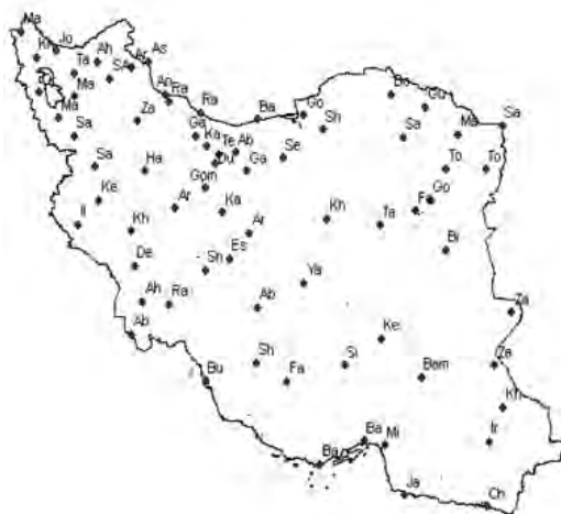
شکل ۱: موقعیت ایستگاه‌های مورد مطالعه

پایه‌های زمانی متداول در شاخص بارش استاندارد عبارتند از ۳، ۶، ۱۲، ۲۴، و ۴۸ ماه که معمولاً بصورت میانگین متحرک بر اساس فرمول زیر محاسبه می‌شود. برای مثال در مورد شاخص بازه سه ماهه شاخص استاندارد به این صورت محاسبه می‌شود: