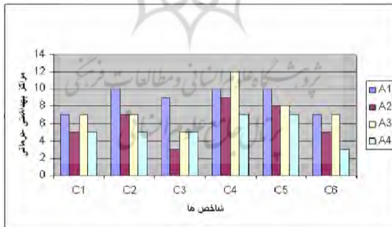
نمودار (۱) ارزیابی نهایی وضعیت مراکز بهداشتی-درمانی شهر زابل بر اساس مدل TOPSIS (نگارندگان، ۱۳۸۹)

در این مرحله با توجه به CL که در مرحله قبل بدست آمده است، می‌توان رتبه‌بندی گزینه‌ها را انجام داد، هر گزینه‌ای که CL آن بیشتر باشد، گزینه ایده‌آل‌تر یا بهتری است. نتایج نهایی محاسبات مدل به صورت A1 > A3 > A2 > A4 اولویت‌بندی‌های را مشخص نمود. نمودار (۱) ارزیابی نهایی وضعیت مراکز بهداشتی-درمانی شهر زابل بر اساس مدل TOPSIS را نشان می‌دهد.