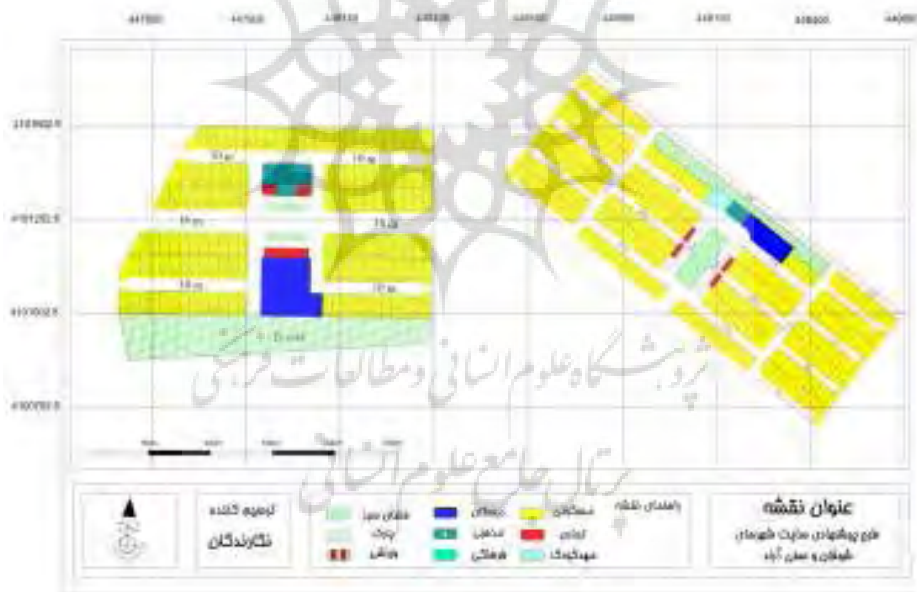
شکل ۵- طرح پیشنهادی سایت شهرهای شوقان و صفی آباد