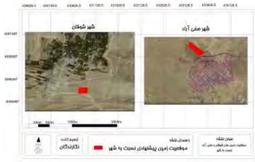
شکل ۲- موقعیت مکانی سایت‌های مسکن مهر شوقان و صفی آباد نسبت به شهر