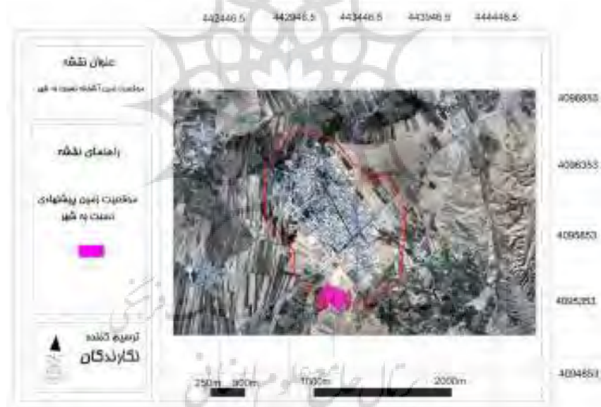
شکل ۳- موقعیت مکانی سایت مسکن مهر آشخانه نسبت به شهر