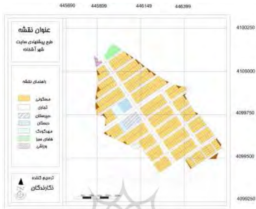
شکل ۶- طرح پیشنهادی سایت شهر آشخانه