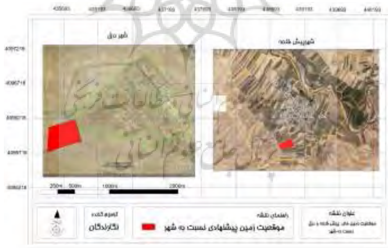
شكل ۱- موقعیت مكانی سایت‌های مسكن مهر درق و پیش قلعه نسبت به شهر

نمونه‌های انتخابی از استان خراسان شمالی و شهرستان‌های، مانه و سملقان، جاجرم، گرمه و اسفراین می‌باشند. در ابتدا به معرفی کلی موقعیت و ویژگی‌های مهم این شهرها به طور خلاصه پرداخته و سپس جدول سطح و سرانه و سایت پلان پیشنهادی طرح مسكن مهر در هر يك، شده است. آنگاه هر يك