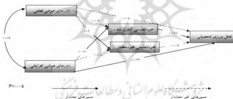
شکل ۲: تحلیل مسیر عوامل مؤثر بر تعلل‌ورزی

جدول ۲ و شکل ۱ ضرایب مسیر برای روابط پیشنهاد شده میان متغیرهای مدل را نشان می‌دهد. با توجه به مسیرهای پیش‌بینی شده، تعلل‌ورزی به وسیله باورهای هوشی افزایشی