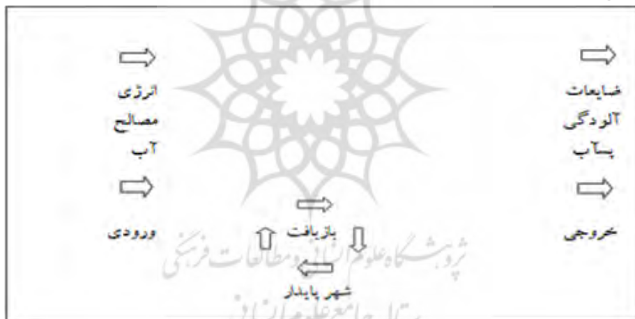
شکل ۱- الگوی شهر پایدار با ورودی و خروجی کم‌تر و بازیافت بیشتر

شهر پایدار شهری است که به دلیل استفاده اقتصادی از منابع، اجتناب از تولید بیش از حد، ضایعات و بازیافت آن‌ها تا حد امکان و پذیرش سیاست‌های مفید، درازمدت قادر به ادامه حیات خود باشد. شهر پایدار در مقابل شهرهای نوگرا با مشخصات حجم زیاد ورودی مواد و انرژی در مقابل حجم زیاد خروجی ضایعات و آلودگی است. برنامه‌ریزان شهر پایدار باید هدفشان را بر مبنای ایجاد شهرهایی با ورودی کمتر انرژی و مصالح و خروجی کمتر ضایعات و آلودگی متمرکز کنند (ترنر، ۱۳۷۶: ۱۸).