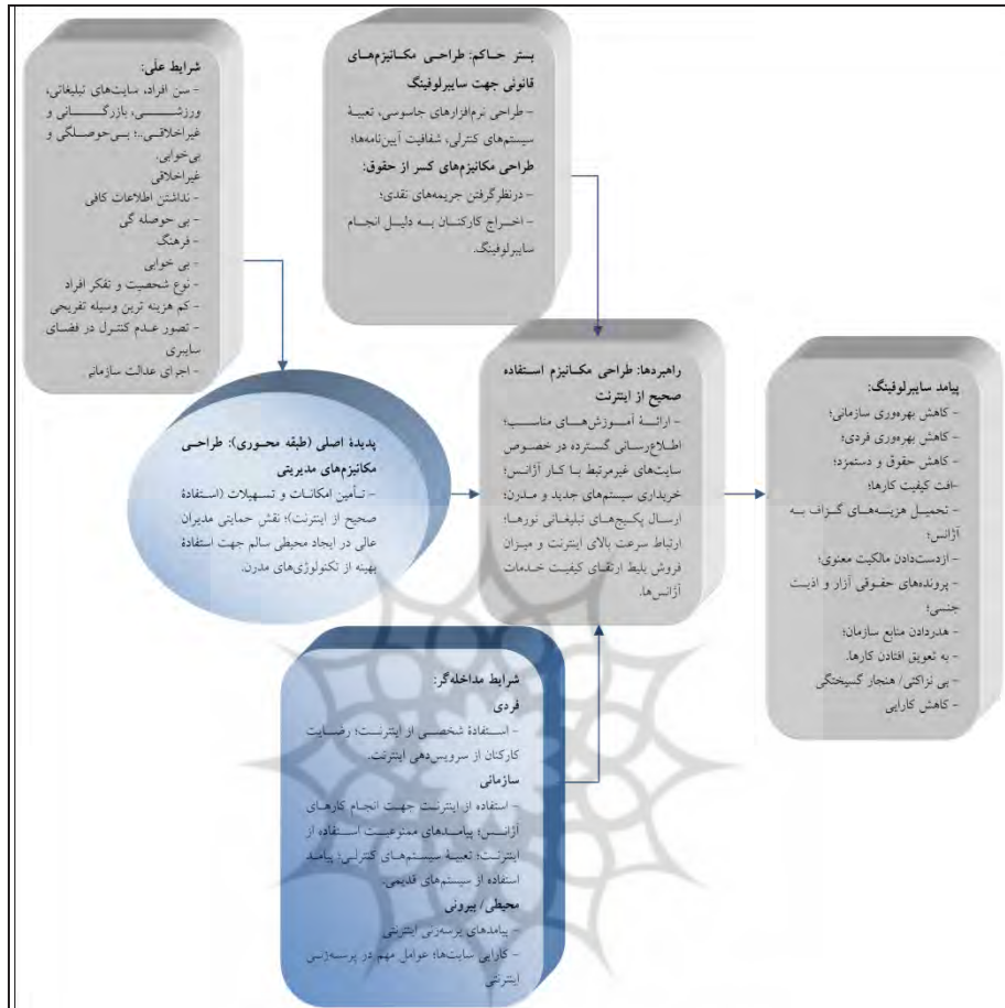
نمودار ۳. کدگذاری محوری بر اساس مدل پارادایم (تصویر مدل تکمیلی)