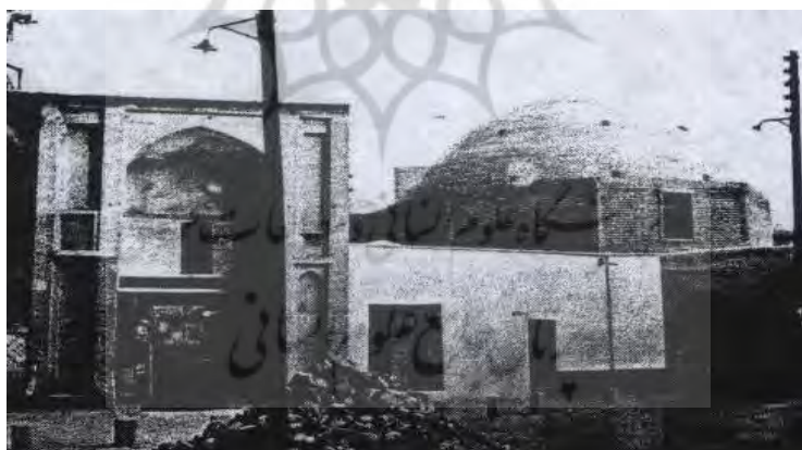
تصویر شماره ۶: نمای بیرونی گنبد آجری مسجد جامع نطنز از آثار متعلق به عصر آل بویه (اقتباس از آزاد، ۱۳۸۰: ۱۸۷)