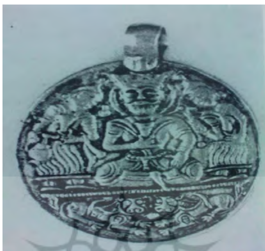
تصویر شماره ۱۱: مدالی از عزالدوله بویه‌ی در حال نوشیدن شراب- محل نگهداری تالار هنری فریر، واشنگتن دی سی (اقتباس از زمانی، ۲۵۳۵: ۱۷۵)