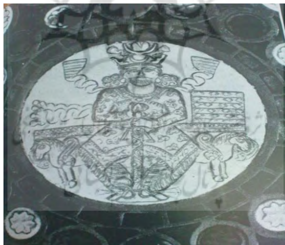
تصویر شماره ۱۲: جامی زرین منقش به تصویر جلوس خسرو یکم بر روی تختی روی شانه‌های حیوان‌های بالدار که پشت به هم کرده‌اند- محل نگهداری کتابخانه ملی پاریس (اقتباس از گیرشمن، ۱۳۷۰: ۳۰۴)