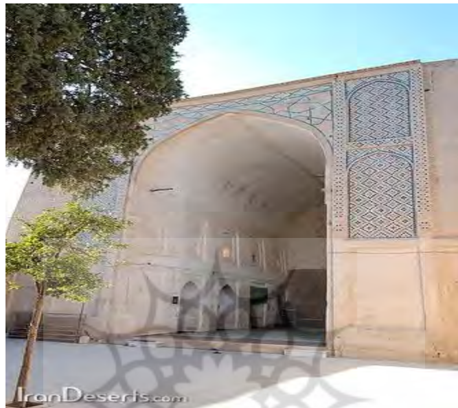
تصویر شماره ۳: ایوان مسجد نیریز متعلق به عهد آل بویه