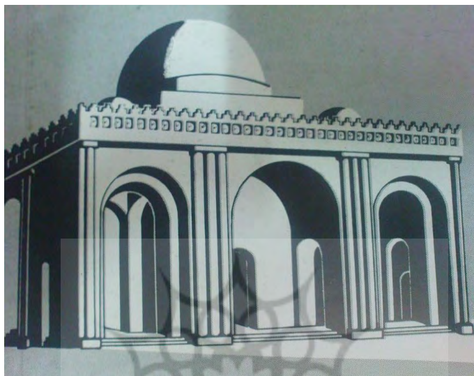
تصویر شماره ۱: نمای بیرونی کاخ سروستان از آثار متعلق به عصر ساسانی که به وسیله سه ایوان به سوی خارج باز می‌شود (اقتباس از گیرشمن، ۱۳۷۰: ۱۷۹)