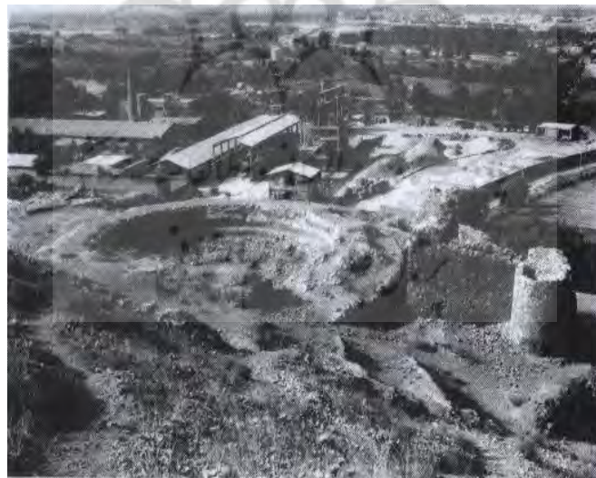
تصویر شماره ۴: مقبره آل بویه و بخشی از قلعه طبرک در ری (اقتباس از آزاد، ۱۳۸۰: ۲۰۵)