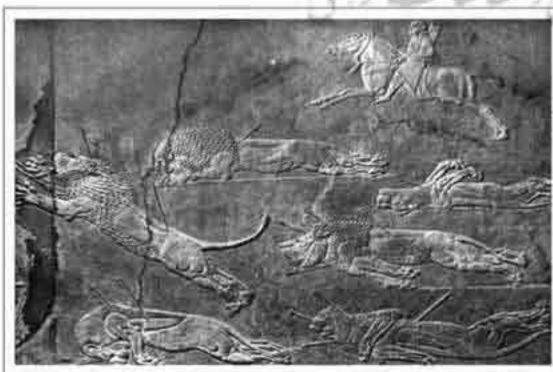
تصویر ۱۲: نمایش شیرهای شکار شده توسط آشور بانپال (موزه بریتانیا؛ ۷۰۰ ق. م؛ ارتفاع ۱/۶۰ س. م؛ سنگ مرمر)

نقوش برجسته بین‌النهرینی (۶۵۰-۱۰۰۰ ق. م) که موضوع آن‌ها شکار است، بسیار جالب توجه می‌باشد. سه پادشاه آشوری، آشور ناصرپال دوم، سارگون دوم، و آشور بانپال