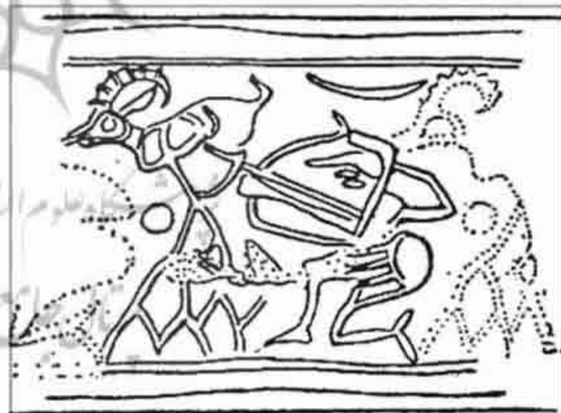
تصویر ۱: شکارچی در حال شکار قوچ کوهی با تیر و کمان (موزه لوور؛ ۱۰۰۰ ق.م؛ ۲/۴×۱ س.م؛ بدل چینی)