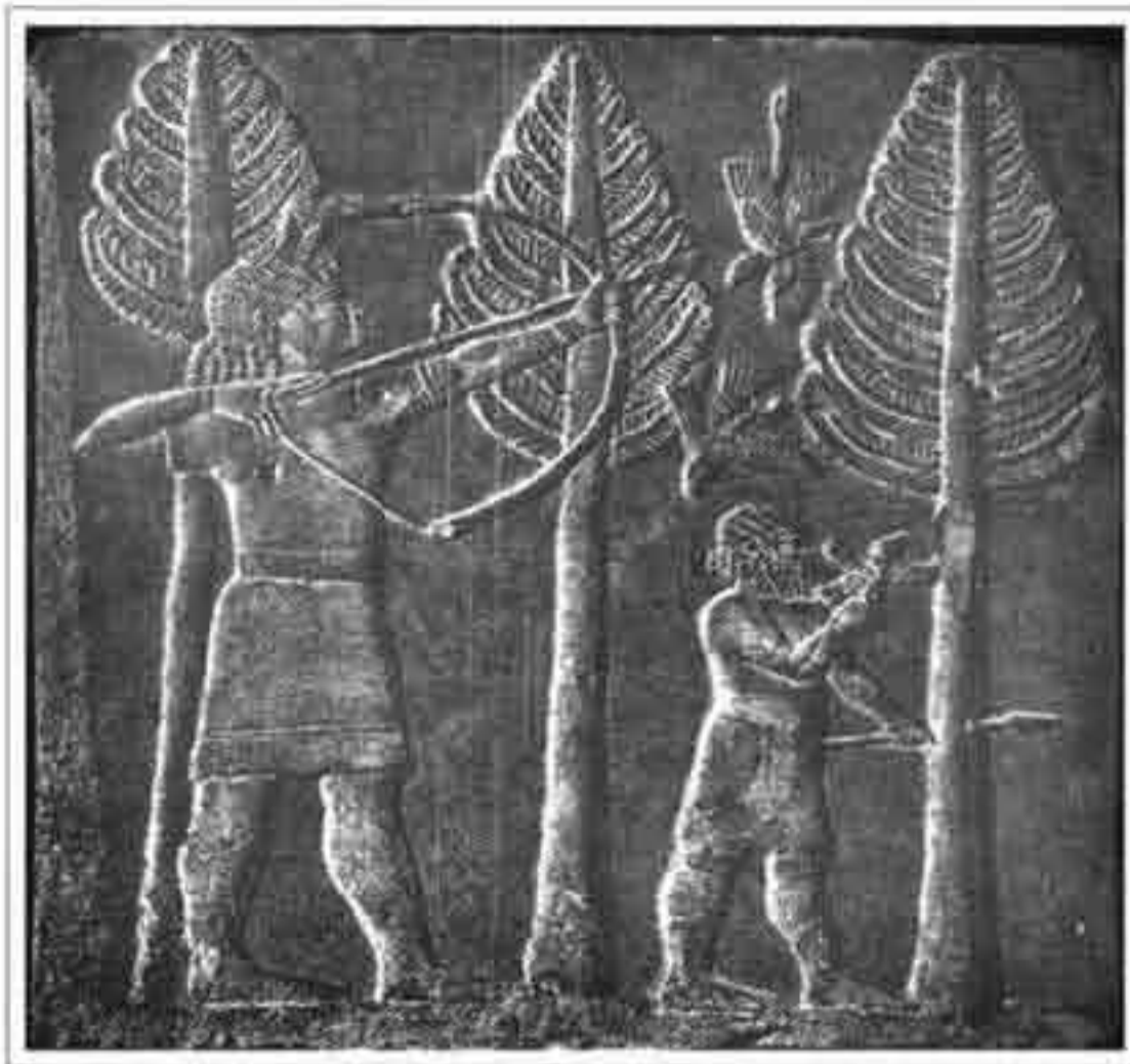
تصویر ۱۴: شکار پرنده توسط سارگون دوم به وسیله تیر و کمان در شکارگاه شاهی (موزه بریتانیا؛ ۸۰۰ ق. م؛ ارتفاع ۱/۲۷ س. م؛ سنگ مرمر)

پوشیده است. هنرمند برای حجاری این نقش برجسته دقت زیادی به کار برده و عضلات بدن شیرها را بسیار زیبا نشان داده است (Ibid, p.58).