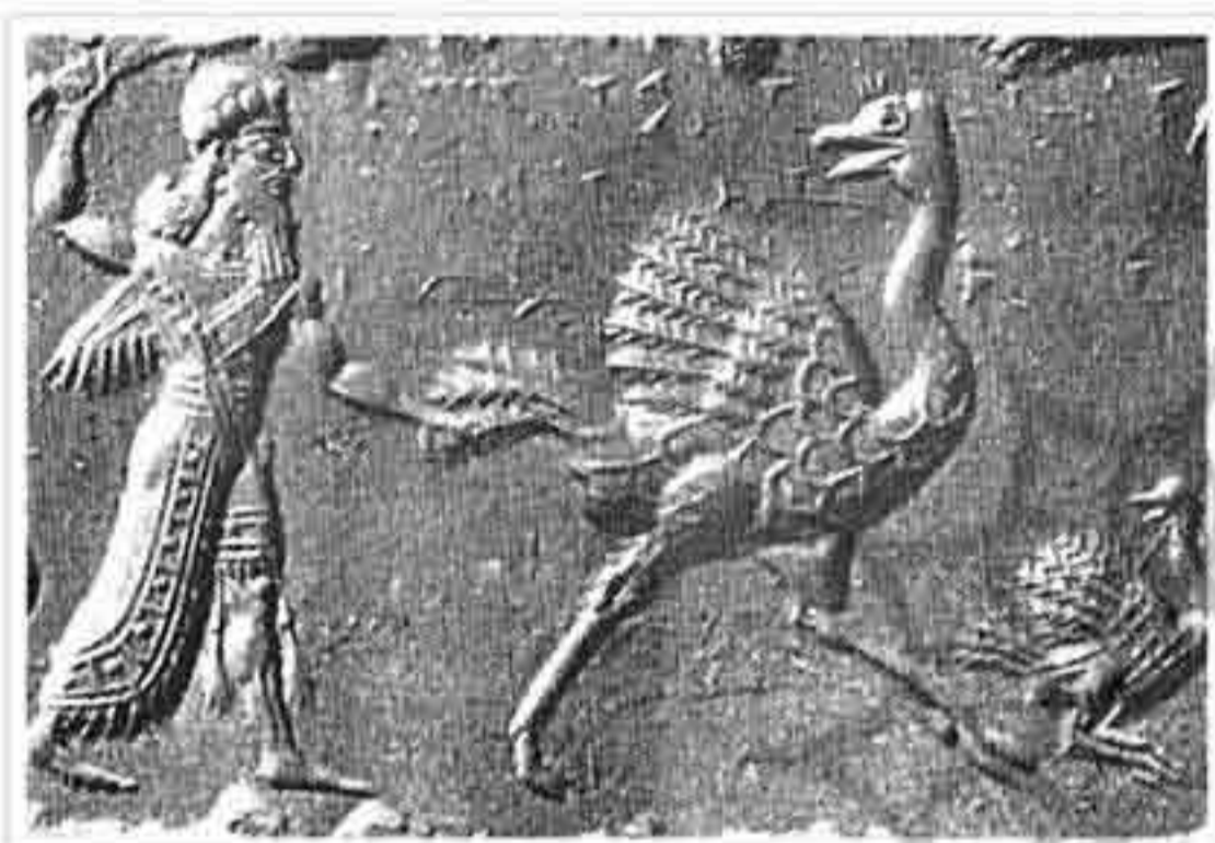
تصویر ۸: شکار پرنده توسط شکارچی به وسیله شمشیر (موزه بغداد؛ ۱۰۰۰ ق. م؛ ۱/۲×۲/۴ س. م؛ سرپنتین)