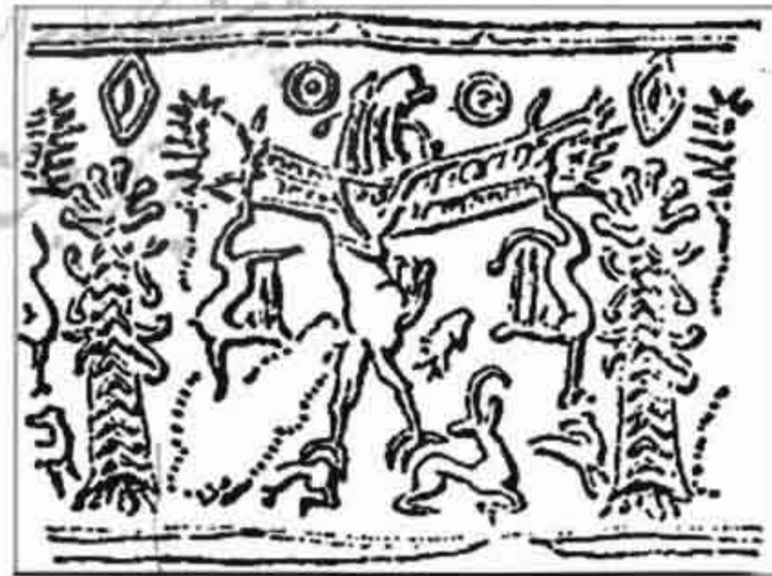
تصویر ۴: شکار قوچ کوهی توسط شیردیو (موزه لوور؛ ۱۰۰۰ ق.م؛ ۳×۲ س.م؛ بدل چینی)

در یکی از مهرهای استوانه‌ای دوره عیلام نو که شکار موجودات ترکیبی را نشان می‌دهد، صحنه‌ای را می‌بینیم که در آن شیردیو حیوانی را شکار می‌کند. شیردیو در مصر نماد مراقبت و قدرت به‌شمار می‌رفت. این نماد در هزاره دوم قبل از میلاد به سرزمین بین‌النهرین و سوریه راه یافت و بعد از گذشت مدتی به سرزمین عیلام وارد شد. شیردیو معمولاً به‌منزله نگهبان یا در حال حمله به حیوانات دیگر نشان داده می‌شود (هال، ۱۳۸۳: ص ۶۴).