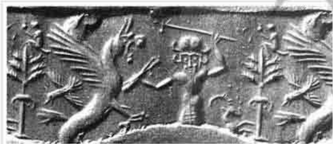
تصویر ۹: پهلوان در حال شکار شیربالدار به وسیله نیزه (موزه بریتانیا؛ ۸۰۰ ق. م؛ ۱×۲/۴ س. م؛ سرپنتین)