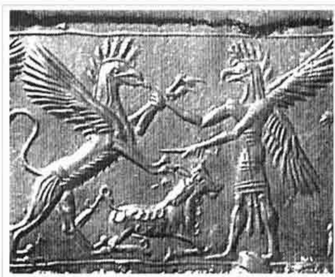
تصویر ۱۰: شکار گاو توسط شیردال (موزه برلین؛ ۸۰۰ ق. م؛ ۱/۸x م. س. م؛ بدل چینی)

نفوذی که در سطح منطقه به دست آورده بودند، توانستند از سرزمین‌های مختلف هنرمندان زیادی را به خدمت درآوردند و با استفاده از آن‌ها آثار زیبا و ماندگاری خلق کنند (نیکنامی، ۱۳۶۹: ص ۱۸).