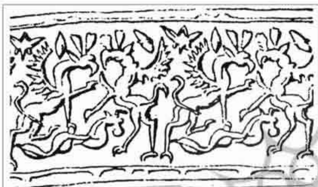
تصویر ۵: شکار موجود ترکیبی با سر گاو به وسیله‌ی دو شیر دال (موزه لوور؛ ۹۰۰ ق. م؛ ۲/۲ س. م؛ غیرطبیعی)

شایسته این سرزمین است. اما هزاره اول ق. م دوران قدرت مشهورترین پادشاهان آشوری مانند سارگون دوم، سناخریب، آسارهادون و آشوربانیپال بود که به ترتیب در پایتخت‌هایی مثل آشور، کلهو، دورا- شرکین و نینوا حکومت کردند. آشوری‌ها توانستند را در نظام سیاسی و مفهوم پادشاهی تغییرات فاحشی به وجود آوردند. آن‌ها نخست ایالت کوچک خود، آشور را گسترش دادند و نظام حکومتی سازمان‌یافته‌ای را بنیان نهادند و سرانجام به امپراتوری عظیمی مبدل شدند.