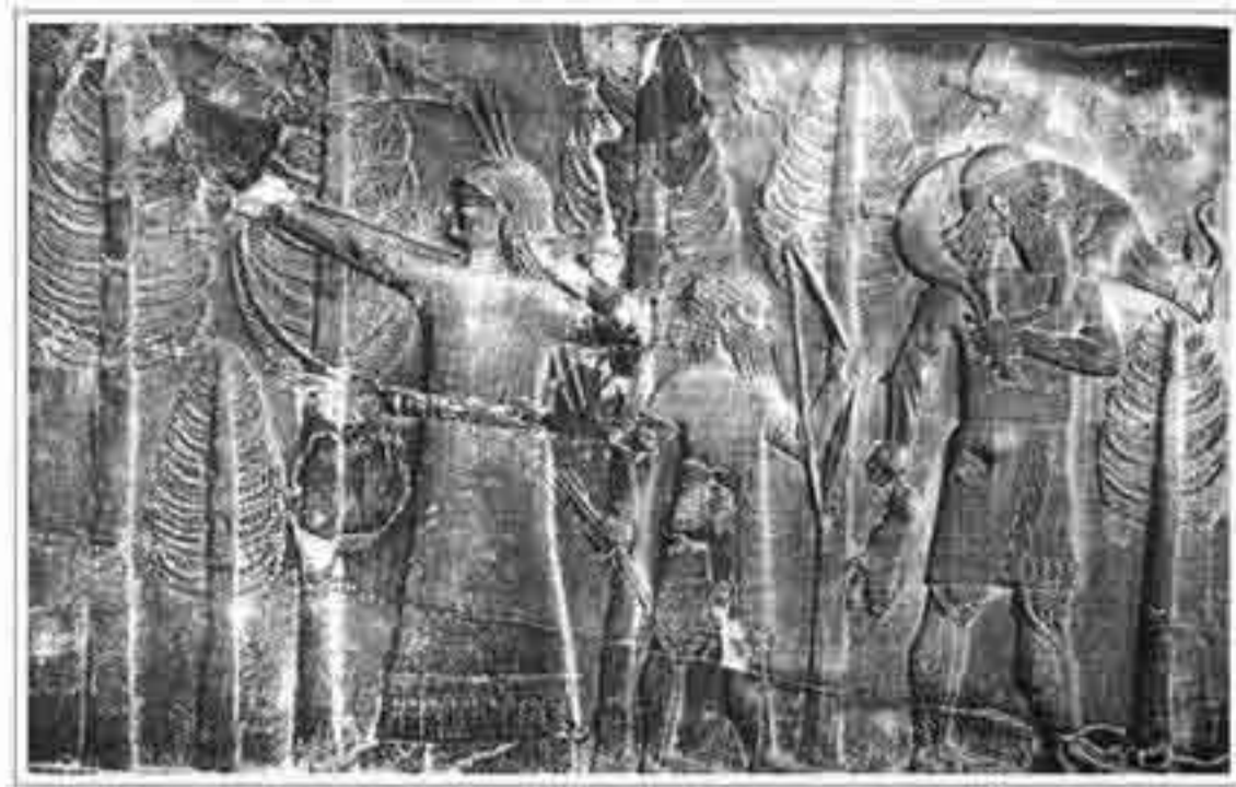
تصویر ۱۳: شکار پرنده توسط سارگون دوم به وسیله تیر و کمان در جنگل (موزه بریتانیا؛ ۸۰۰ ق. م؛ ارتفاع ۱/۲۷ س. م؛ سنگ مرمر)

در نقش برجسته دیگری، پادشاه سارگون دوم در حال شکار در شکارگاه شاهی مشاهده می‌شود. پادشاه تیر و کمان در دست دارد و در حال تیر اندازی به سوی دو پرنده‌ای است که در آسمان پرواز می‌کنند. او لباس بلندی بر تن دارد و موهایش بافته‌شده است. در مقابل پادشاه، ملازم او دیده می‌شود که در یک دست پرنده شکارشده را گرفته و در دست دیگر یک تیر دارد. ملازم موها و ریش بلندی دارد. پادشاه بسیار بزرگ نشان داده شده است؛ شاید