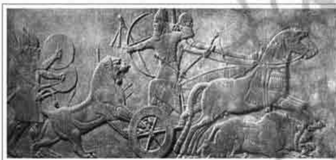
تصویر ۱۱: شکار گاو وحشی توسط آشور ناصرپال دوم به وسیله نیزه (موزه بریتانیا؛ ۹۰۰ ق. م؛ ارتفاع ۹۵ س. م؛ سنگ مرمر)