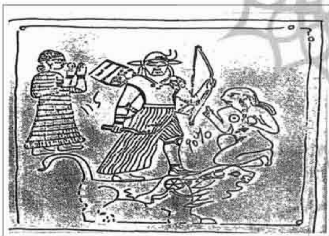
تصویر ۶: شکار شیر به وسیله‌ی خدای نرگال (موزه ایران باستان؛ ۱۰۰۰ ق. م؛ ۱۰×۷/۵ س. م؛ مفرغ)

آشوری‌ها به دلیل کشمکشی که با همسایگان شمالی و غربی داشتند، نتوانستند زمان زیادی را صرف آفرینش‌های هنری کنند (مجیدزاده، ۱۳۸۰: ص ۱۷۹). اما قدرت نظامی آشوری‌ها به آن‌ها امکان داد که هنرمندان زیادی را از سرزمین‌های مجاور به خدمت بگیرند و از آن‌ها در ساختن کاخ‌ها و خلق آثار هنری استفاده کنند (ژرژرو، ۱۳۷۲: ص ۸۶). در این مقاله، تمام نقوش شکار در نمونه‌های هم‌زمان بین‌النهرینی در محدوده زمانی (۶۵۰-۱۰۰۰ ق. م)