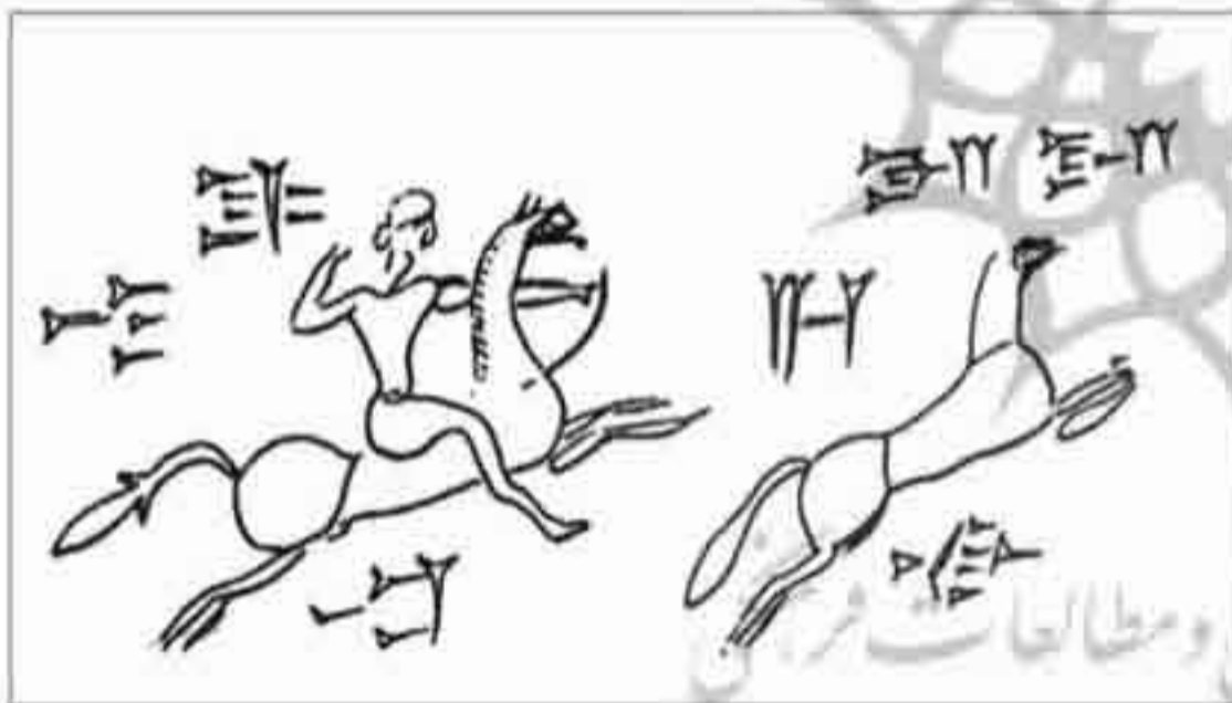
تصویر ۲: شکارچی سوار بر اسب در حال شکار الاغ وحشی با تیر و کمان (موزه لوور؛ ۱۰۰۰ ق.م؛ ۲/۲×۱/۵ س.م؛ سنگ آهکی روشن)

از دوره عیلام نو مهر استوانه‌ای دیگری به‌جا مانده است که نقش شکار حیوانی را نشان می‌دهد. در سمت چپ این مهر، فردی شکارچی را مشاهده می‌کنیم که لباس بلندی بر تن دارد، روی زمین زانو زده است، و در حالی که کمانی را در دست گرفته به سوی پرنده‌ای تیراندازی می‌کند.