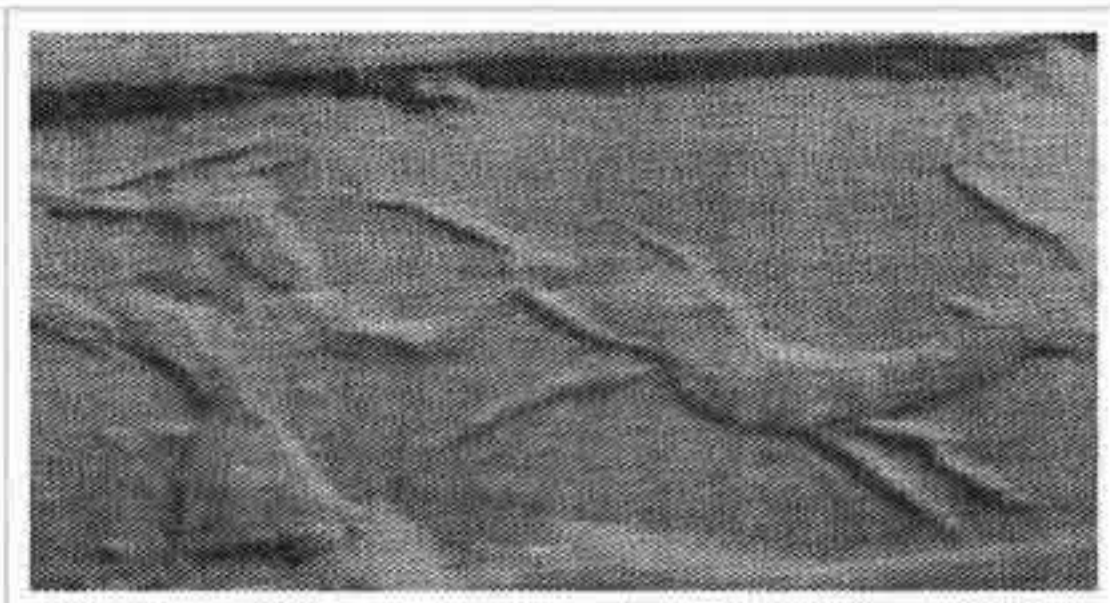
تصویر ۷: شکار قوچ کوهی توسط شکارچی به وسیله شمشیر (موزه بغداد؛ ۱۰۰۰ ق. م؛ ۱/۲×۱/۴ س. م؛ سرپنتین)

آشوری است. هنرمند حکاک در خلق این مهر دقت زیادی به کار برده است (مجیدزاده، ۱۳۸۰: ص ۲۲۱).