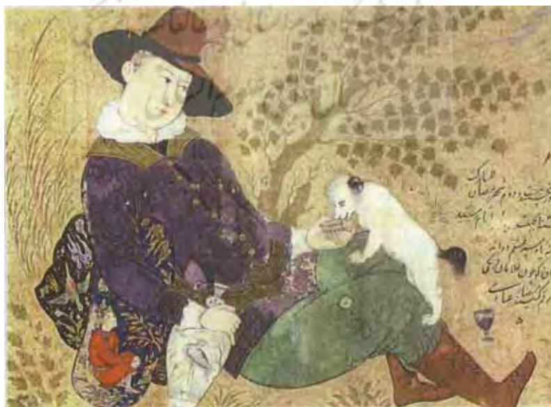
تصویر ۳: فرنگی در حال دادن شراب به سگ (اصفهان، ۱۰۳۷ هـ، رضا عباسی، آبرنگ روی کاغذ، مجموعه موريسن)

چنان از حضور و نقش آرمانی این عنصر غافل شد که اصلاً در برخی نگاره‌ها، به کلی آن را از یاد برد. در نهایت، در تک‌نگاره‌های مکتب اصفهان، نسبت بین انسان و طبیعت - که در نگارگری پیش از آن تا حد زیادی هم‌ارزش بود - به انسان ختم شد. این تغییر نگرش در بستر رویدادهایی به‌وجود آمد که حضور اروپاییان و جاذبه‌های فرهنگی ایشان در ایران از تأثیرگذارترین آن‌ها بود. سیر تحولی این نگره را می‌توان در آثار هنرمندان برجسته این مکتب دنبال کرد. هنرمندی که مکتب اصفهان با نام آن گره خورده، رضا عباسی است. چهارچوب کلی این مکتب را با وی و بر مبنای آثار او شناسایی می‌کنند. رضا عباسی دستاورد گذشتگان، به‌ویژه واقع‌گرایی بهزاد، را با سبک شخصی خود آمیخت. «او را طراحی بالفطره، با اصالتی ممتاز و با قدرت واقع‌گرایی جدیدی می‌یابیم که قلم استادانه‌اش انواع مردم عادی را که او در زندگی روزانه‌اش می‌دید، برمی‌گرفته و با خطوط مختصر تند ثبت می‌کرده است» (بینیون، ۱۳۶۷: ص ۳۸۴). در آثار و به‌ویژه تک‌نگاره‌های رضا عباسی، نقش و اهمیت انسان نسبت به عناصر و موضوع‌های دیگر بیشتر شد و طبیعت دیگر آن ماهیت آرمانی را نداشت (تصویر ۳).