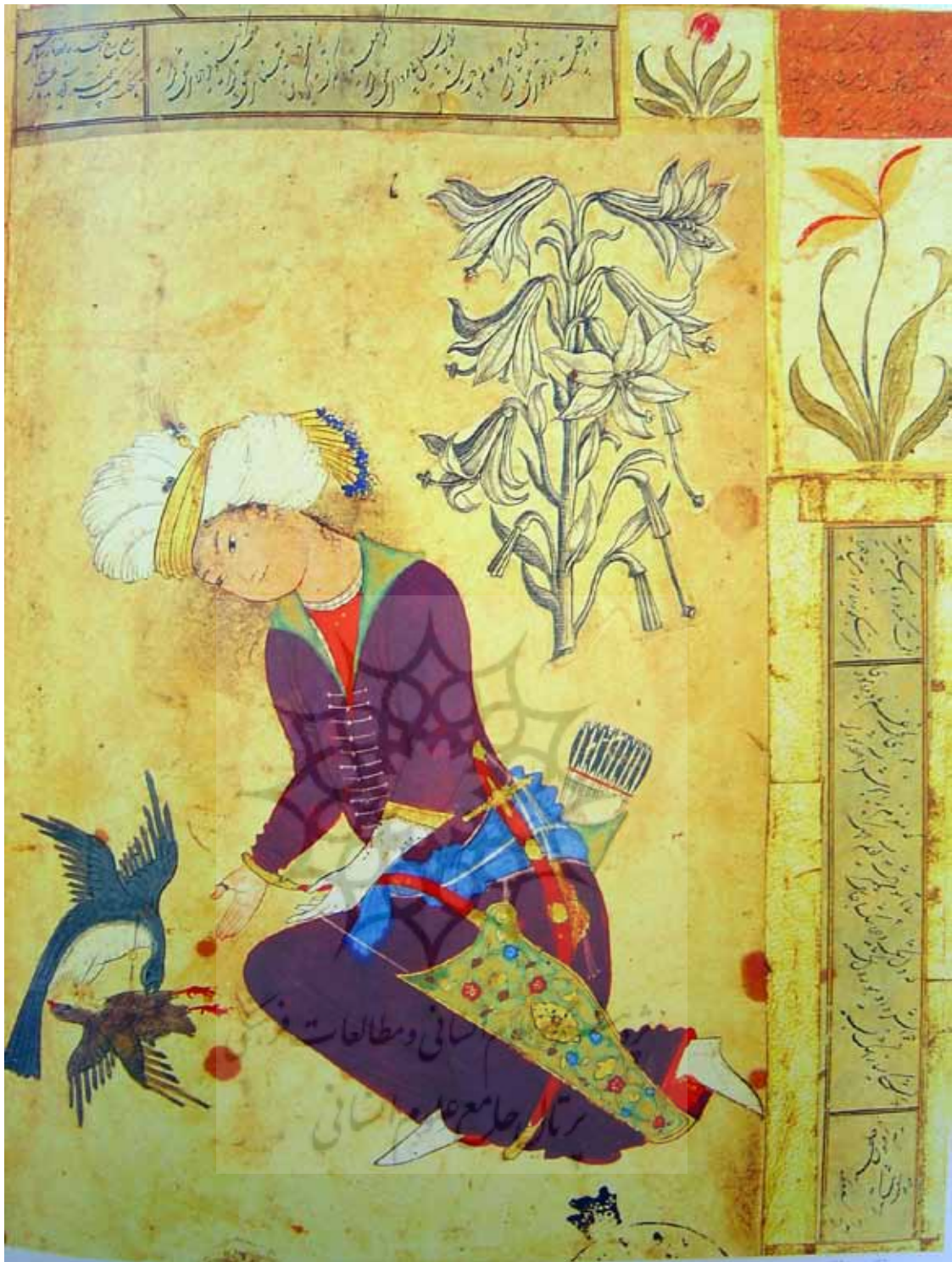
تصویر ۵: شکار و شکارچی (هنرمند نامعلوم، مرقع ۱۶۳۲، کاخ گلستان)

در ادامه این سنت، محمد زمان کاملاً به الگوی طبیعت‌نگاری اروپایی جلب می‌شود و در این مورد از سنت رضا عباسی نیز فاصله می‌گیرد. به این ترتیب، دوران جدیدی در نقاشی ایرانی به وجود می‌آید؛ دورانی که نقاشان با اتکا به سنت و آنچه از دنیای غرب به ایران می‌آمد، به آفرینش و ابداع