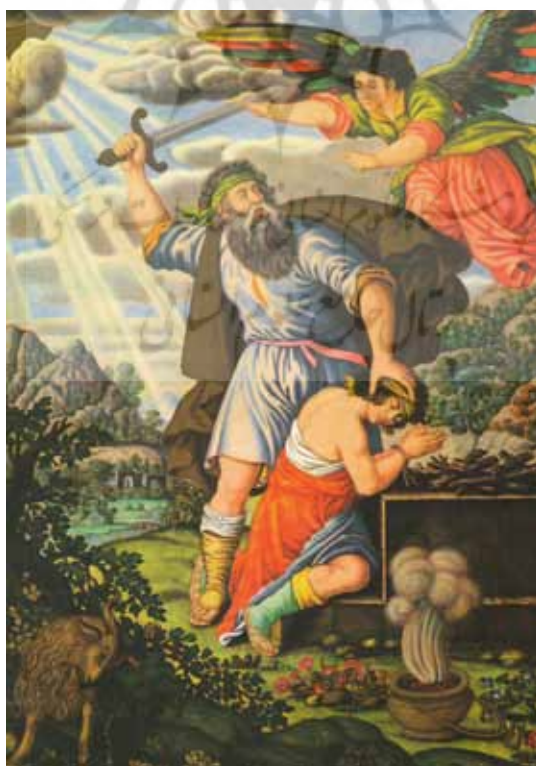
تصویر ۷: قربانی کردن حضرت ابراهیم (اصفهان، ۱۰۹۶ هـ، محمد زمان، انستیتوی مطالعات شرقی آکادمی علوم روسیه، سن پترزبورگ)

هنری دورگه دست زدند. در این دوران، نقاشی ایران «تأثیرات اروپایی را تجربه کرد. اثرپذیری از چند طریق صورت گرفت: آثار هنری اروپایی وارد شده به ایران و تماس مستقیم با نقاشان اروپایی مقیم اصفهان، نقاشیان ارمنی مقیم جلفای نو، و آثار نقاشان مکتب گورکانی هند» (پاکباز، ۱۳۸۰: