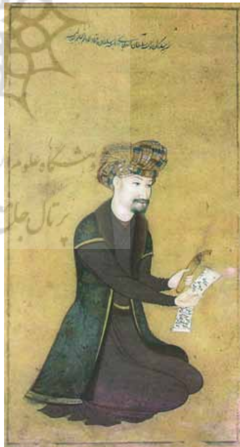
تصویر ۴: پیکر خلیفه سلطان وزیر (اصفهان، حدود ۱۰۶۰ هـ، منسوب به معین مصور)

«در مجالس او آدم‌ها معدود، بزرگ‌تر از اندازه متعارف، و غالباً بی‌ارتباط با محیط هستند. نظام رنگ‌بندی و ساختار فضا نیز در کار او بسیار ساده شده‌اند. بدین‌سان، رضا عباسی از آن قانونمندی‌های زیبایی‌شناختی دقیق و پیچیده که در خلال چند قرن تجربه حاصل شده بود، عدول کرد. در واقع، در هنر او خط بر رنگ فایق آمد» (پاکباز، ۱۳۸۰: ص ۱۲۳). با وجود این، رضا عباسی هنوز به بسیاری از اصول نگارگری کلاسیک ماقبل خود که بیشتر در کتاب‌آرایی بود، وفادار بود و آرمان‌های زیبایی‌شناسی اصیل و بومی نگارگری در آثارش غالب بود. ولی پس از وی، گرایش به غرب‌شدت پیدا کرد و «هنرمندان احساس می‌کردند که مکتب رضا عباسی جایی برای ابتکار عمل و نوآوری باقی نگذاشته است، و مانند گذشته برای الهام به سرچشمه‌های دیگری توجه کردند. تفاوت این بار در این بود که سرچشمه الهام نه چین، بلکه اروپا بود» (همان، ص ۱۱۵).