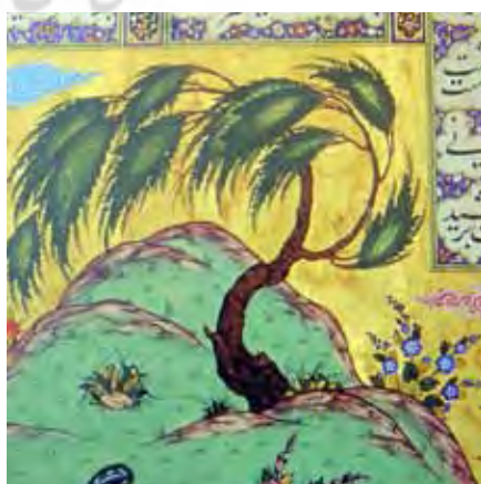
تصویر ۱: نمونه‌ای از درختان و گیاهان نقاشی شده در شاهنامه شاه تهماسب (موزه هنرهای معاصر، ۱۳۸۴)