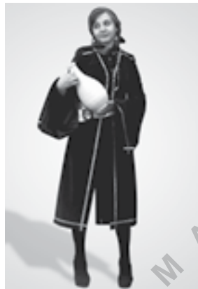
تصویر شماره ۳: دوخت نهایی مدل شماره (۳)