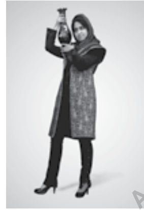
تصویر شماره ۱: دوخت نهایی مدل شماره (۱)

مثلثی شکل زنان در مینیاتورهای زیبای این دوره طراحی شده است و برای هماهنگی بیشتر شکل کلی لباس، یقه کت نیز به اصطلاح به شکل هفت طراحی شده است. ریان دوزی روی لباس یادآور ریان دوزی‌ها و تزئینات زیبای لباس زنان در این دوره می‌باشد.