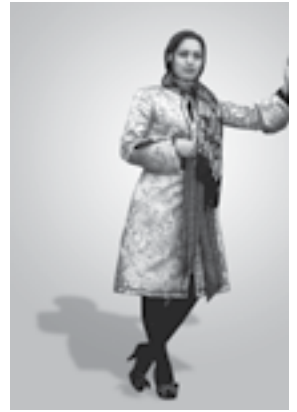
تصویر شماره ۵: دوخت نهایی مدل شماره (۵)