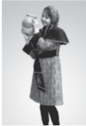
تصویر شماره ۸: دوخت نهایی مدل شماره (۸)