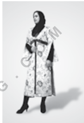
تصویر شماره ۲: دوخت نهایی مدل شماره (۲)