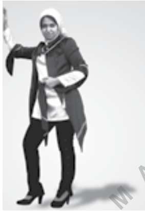
تصویر شماره ۷: دوخت نهایی مدل شماره (۷)