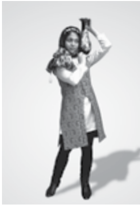
تصویر شماره ۴: دوخت نهایی مدل شماره (۴)