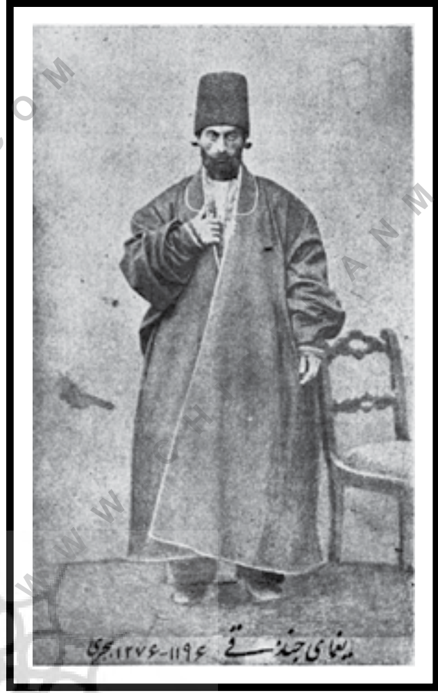
یغمای جندقی؛ شاعر عهد قاجار