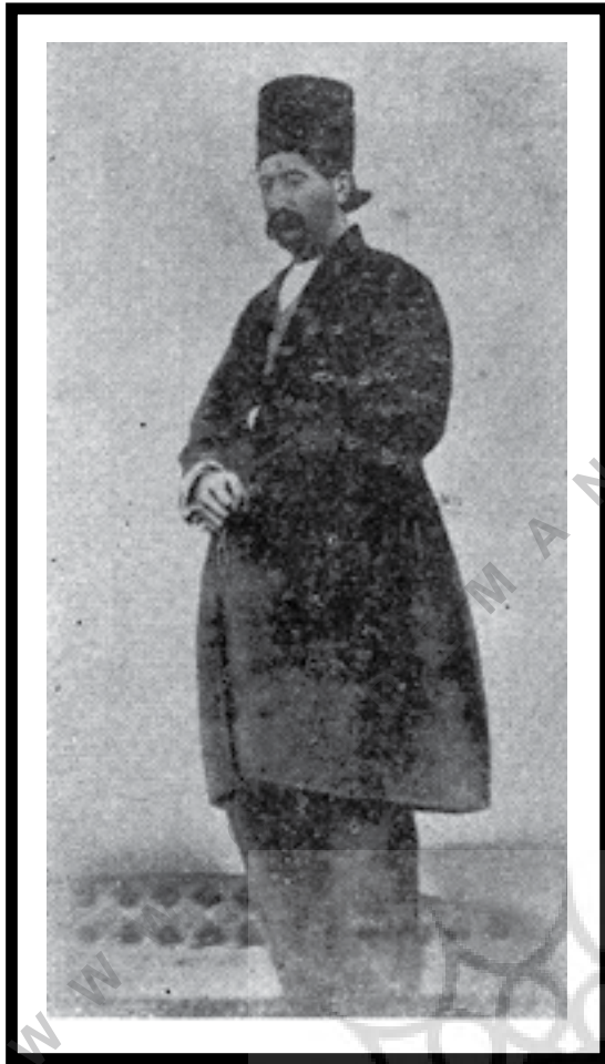
میرزا ابراهیم دستان (یغمای ثانی) فرزند یغای جندقی.