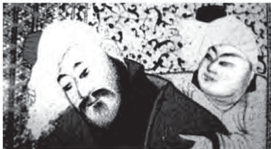
تصویر ۵. نمونه‌هایی از چهره‌پردازی سلطان محمد، دوره صفوی، مأخذ: آژند، ۱۳۴۸: ۱۴۹.

یافت. مغولان علاقه زیادی به جاودانه ساختن نام خود داشتند. این را به وضوح می‌توان از حمایت درباریان از کتاب‌آرایی کتب تاریخی مغول دریافت. با توجه به این نکته، شاید یکی از عوامل علاقه مغولان به هنر چین نزدیک بودن چهره‌نگاری چینیان ۱ به سیمای مغولی است که منجر به جاودانه ساختن چهره‌های مغولان در نگاره‌ها می‌شد. البته نباید فراموش شود که شاعران ایران نیز به تأثیر هنر مانوی و بودایی ویژگی چهره زیبا را چشمان کشیده، بینی باریک، لب‌های کوچک و صورتی چون قرص ماه توصیف می‌کردند که به صورت قراردادهای چهره‌نگاری مغول بدل گشت.