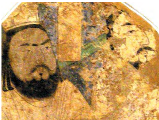
تصویر ۱. بخشی از دیوارنگاره مانوی، خوچ، سده‌های هشتم و نهم میلادی.

می‌دهد. «فرایند کارآموزی در کتابخانه غیررسمی و دارای ساختار محدود بود. اعضای کارگاه پیش از رسیدن به مقام استادی مراحل مختلفی را می‌گذراندند و یکی از این مراحل صدور اجازه‌نامه از جانب یک استاد بود که پس از آزمون انجام می‌گرفت. مسئله آزمون خصوصاً در مورد هنرمندانی که می‌خواستند وارد دربار شوند مصداق داشت» (آژند، ۱۳۸۴: ۹).