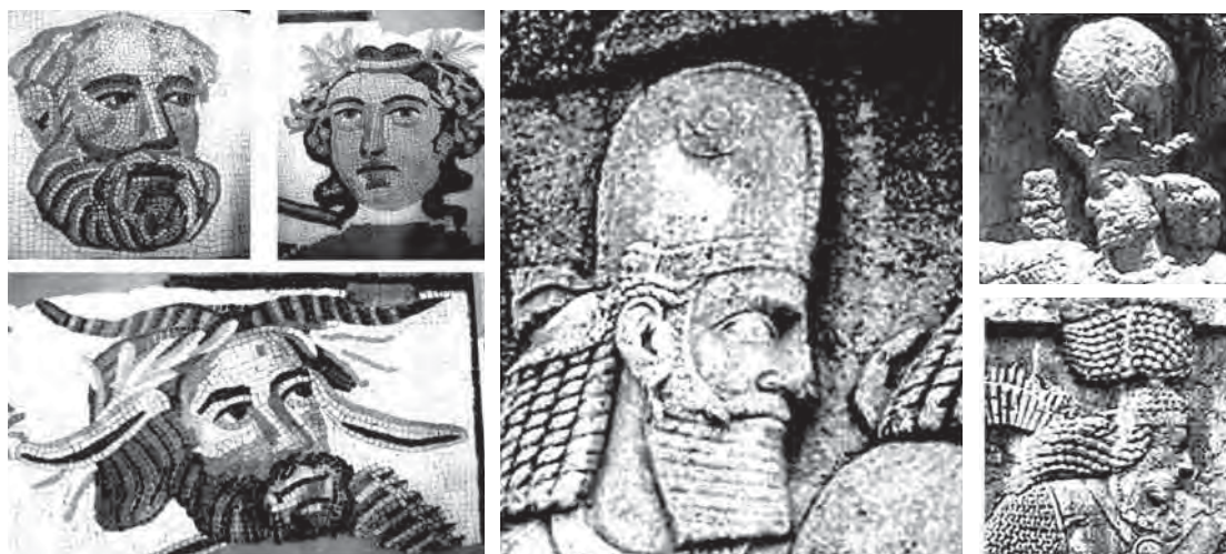
تصویر ۲. نمونه‌هایی از چهره‌های فاقد شخصیت‌پردازی در نقش برجسته‌ها و موزاییک‌های ساسانی.

چهره‌نگاری در سده‌های نخستین اسلام و سلجوقی پس از ظهور اسلام در سرزمین حجاز، به نظر می‌رسد صورت‌نگاری تاحدی با محدودیت روبه‌رو شده است. اعراب جاهلیت پیوند عمیق عقیدتی با آثار نقاشی و مجسمه‌سازی داشتند و از منظر زیبایی‌شناسی به آن نمی‌نگریستند.