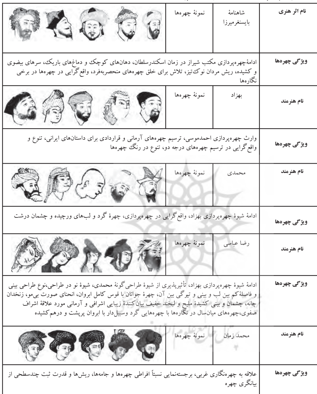
جدول ۷. مقایسه چهره‌پردازی‌های محمد زمان با هنرمندان پیش از او

فردیت هنری در چهره‌پردازی‌های هنرمند مشهودتر است. این موضوع، با توجه به تغییرات قابل توجه چهره‌ها نسبت به دوره‌های پیشین، در دوره تیموری بسیار مشهود است، چنان‌که چهره‌نگاری در این دوره تحولاتی درخشان می‌یابد. در دوره تیموری هنر و هنرپروری در دو شهر هرات و شیراز متمرکز بود. «اگر ما مکتب نگارگری تبریز ایلخانی و شیراز و هرات تیموری را در سه زاویه مثلثی قرار دهیم، مکتب شیراز در زاویه میانی آن قرار