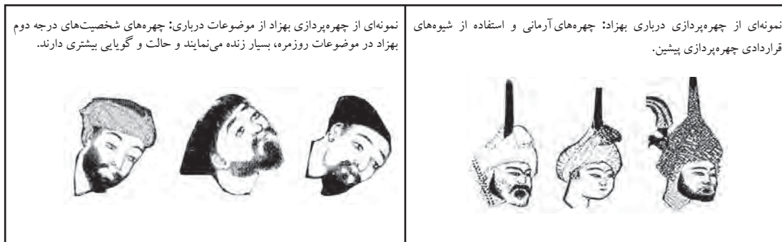
نمونه‌ای از چهره‌پردازی درباری بهزاد: چهره‌های آرمانی و استفاده از شیوه‌های قراردادی چهره‌پردازی پیشین.