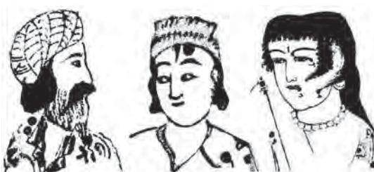
تصویر ۳. نمونه‌هایی از چهره در صور الكواكب الثانیه.

«دوست محمد، نگارگر دوره صفوی، سرچشمه نقاشی سنتی ایران را به سلطنت ابوسعید نسبت می‌دهد و می‌گوید: در زمان او استاد احمد موسی، شیوه جدیدی در ترسیم نقاشی، مخصوصاً چهره‌ها، ابداع می‌کند که تا به امروز (زمان خودش) نیز تداوم یافته است» (برند، ۱۳۸۳: ۱۴۱). از جمله آثار احمد موسی می‌توان به نسخه‌های ابوسعیدنامه، کلیله و دمنه، معراج‌نامه و تاریخ چنگیزی اشاره کرد. شیوه ابداعی احمد موسی در چهره‌نگاری توسط شاگردانش به مکاتب نگارگری بعدی و در دوره تیموری به بهزاد منتقل