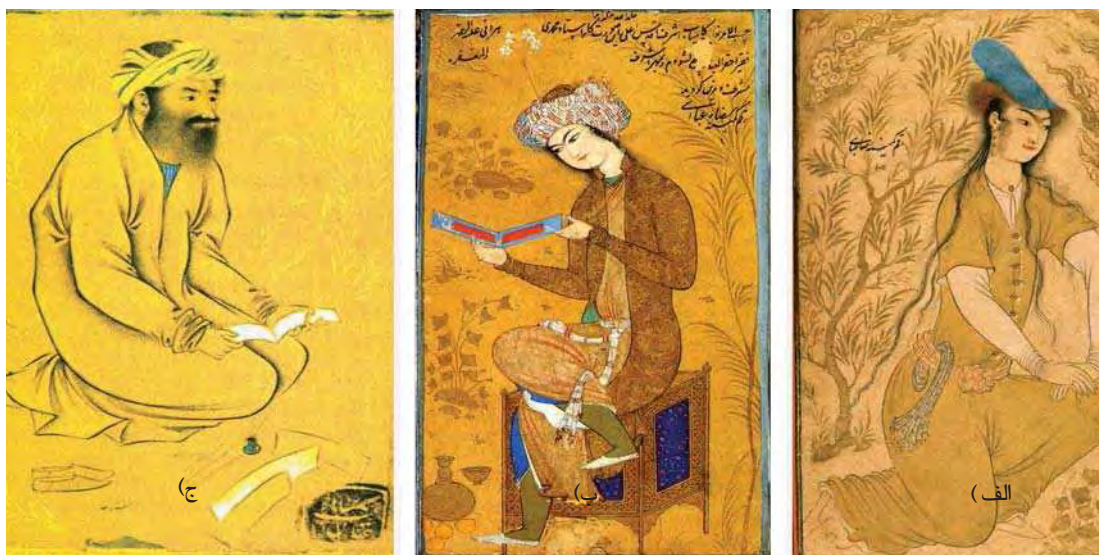
تصویر الف. نمونه‌هایی از چهره‌پردازی رضاعباسی از پیکره‌ها در سنین مختلف، مأخذ: کن‌بای، ۱۳۷۸: ۱۰۲. تصویر ب و ج. نمونه‌هایی از چهره‌پردازی رضاعباسی از پیکره‌ها در سنین مختلف، مأخذ: www.commof.wikimedia.org

جامعه هنری در به‌کارگیری الگوها و قراردادهای پیشین. همان‌طور که در جدول ۵ مشاهده می‌شود، از دیگر ویژگی‌های نگاره‌های بهزاد تنوع در حالت‌ها، قیافه‌ها و رنگ چهره‌هاست. نکته قابل توجه دیگری که پژوهشگران درباره نگاره‌های او اشاره می‌کنند این است که «در قلم بهزاد ظاهراً حالت طنزی که امروز مایه کاریکاتور شده است گاه با مینیاتور آمیخته است و اگر تعداد قابل توجهی از آثار استاد باقی مانده بود شاید او را از پیش‌قدمان کاریکاتورسازی نیز بتوان محسوب کرد» (شایسته‌فر، ۱۳۸۲: ۷۶). «سبک بهزاد ریشه در سبک ابداعی احمد موسی دارد» (بهادری، ۱۳۸۳: ۱۰) و به‌طور غیرمستقیم و امدار سنت‌های چهره‌نگاری این هنرمند است که نسل به نسل از استادان به شاگردان انتقال یافت تا به دست بهزاد پرورانه شد.