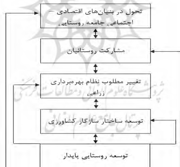
شکل ۲: جایگاه تحول در بنیان‌های اقتصادی - اجتماعی و مشارکت جامعه روستایی در توسعه پایدار

مشارکت در شکل سنتی خود، حالتی خودجوش و طبیعی داشته و ناشی از نیازهای اجتماعی، اقتصادی و روانی بوده‌است؛ البته در صورت قدیمی خود، حالت اجباری و تحمیلی در قالب بیگاری نیز داشته‌است. در واقع مشارکت را می‌توان درگیری مستقیم مردم در تصمیم‌گیری‌ها از طریق یکسری مکانیزم رسمی و غیر رسمی دانست (Schatzow, 1977: 141). به بیان دیگر، تحول در بنیان‌های اقتصادی - اجتماعی جامعه روستایی دارای اثر متقابل در افزایش مشارکت آنان می‌باشد که با حصول این امر، امکان تغییر مطلوب نظام بهره‌برداری زراعی، توسعه کشاورزی متناسب با ساختارهای موجود و در نهایت توسعه روستایی پایدار وجود خواهد داشت.