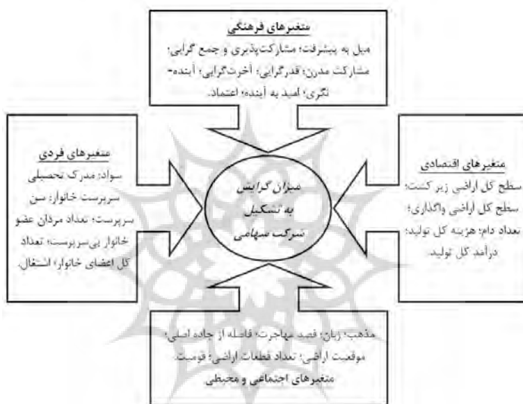
شکل ۳: عوامل اثرگذار در تشکیل شرکت سهامی زراعی

از آن‌جا که در نظام خرده مالکی هزینه‌های تولید به نسبت درآمد نهایی بالاتر است و از سوی دیگر پیوند این نوع نظام بهره‌برداری با باورهای فرهنگی - مذهبی جامعه سبب کاستن از سطح زیر کشت اراضی شده‌است، امکان ارضاء میل به پیشرفت به ویژه پیشرفت اقتصادی را برای بهره‌برداران فراهم نمی‌سازد که خود، نوعی نارضایتی شغلی را سبب می‌گردد. به