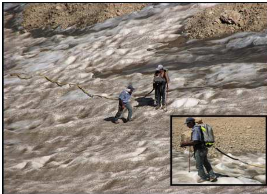
شکل ۲) عملیات عمق سنجی مؤسسه تحقیقات آب در بخشی از یخچال های زردکوه در شهریور ۱۳۸۹