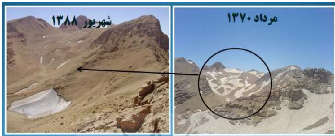
شکل ۱) تفاوت سطح در بخشی از یخچال های اشتران کوه در مرداد ۱۳۷۰ و شهریور ۱۳۸۸ (مؤسسه تحقیقات آب، ۱۳۸۸)

در این خصوص توسط Mousavi و همکاران (۲۰۰۹، ۹۳)، انجام شد که در آن از تصاویر ماهواره ای استفاده گردیده است. این محققین فهرست برداری جدیدی از یخچال های کشور ارائه دادند که نهایتاً سطح کل را حدود 27 \text{ km}^2 محاسبه نمودند. وجود اختلاف در سطوح اعلام شده تا حدی به این دلیل است که بخشی از یخچال های کشور در زیر واریزه ها مدفون هستند که اندازه گیری آنها را با مشکل مواجه می کند. از سوی دیگر زوال آنها در فاصله زمانی دو تحقیق می تواند عامل دیگری باشد که در گزارشات مختلف به آن اشاره شده است (Ferrigno, ۱۹۹۱ و وزیر، ۱۳۸۲).