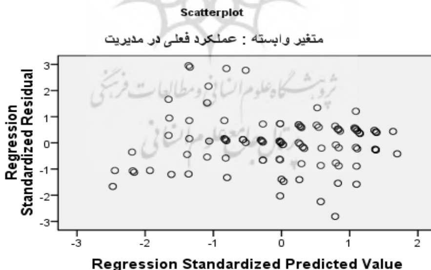
شکل ۲ - پراکنش باقیمانده‌های استاندارد شده در مقابل اندازه‌های پیش‌بینی استاندارد شده

- در شکل ۳، نمودار پراکنش آماری باقیمانده‌های استاندارد شده در مقابل پیش‌بینی استاندارد شده روندی مشاهده نشده و تقارن مشاهدات حول خط صفر است. بنابراین همسانی واریانسهای باقیمانده‌ها را می‌توان مورد تأیید قرار داد.