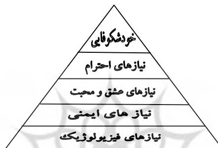
شکل ۱ - الگوی سلسله مراتب نیازها (مزلو، ۱۹۸۷)

برانگیخته را شرح می‌دهد و به طور عمده با آنچه در درون فرد یا محیطش می‌گذرد و به رفتار فرد نیرو می‌بخشد سرو کار دارد؛ به عبارت دیگر این نظریه‌ها به مدیر نسبت به نیازهای کارکنانش بیش می‌دهد و به او کمک می‌کند تا بداند کارکنان به چه چیزهایی به عنوان پاداش کار یا ارضا کننده ارزش می‌دهند در حالی که نظریه‌های فراگردی چگونگی و چرایی برانگیختگی افراد را توصیف می‌کند (رضائیان، ۱۳۷۹: ۱۰۴).