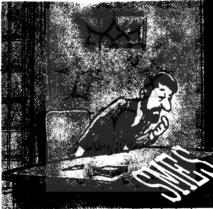
صنایع بزرگتر و جذاب‌تر می‌شوند.

۵- تسامین نیروی انسانی متخصص برای شرکتها بزرگ غالباً توسط شرکتها کوچک و متوسط صورت می‌گیرد. این مسأله به صورت یکی از مشکلات کنونی این بنگاهها درآمده است زیرا افراد متخصص غالباً پس از کسب تجربه در شرکتها کوچک و متوسط جذب