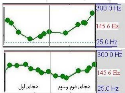
شکل (۱) منحنی میانگین فرکانس پایه محدوده زمانی هجای اول و هجاهای دوم و سوم عبارات هدف نوع اول در سطح تمامی گویشوران و جملات