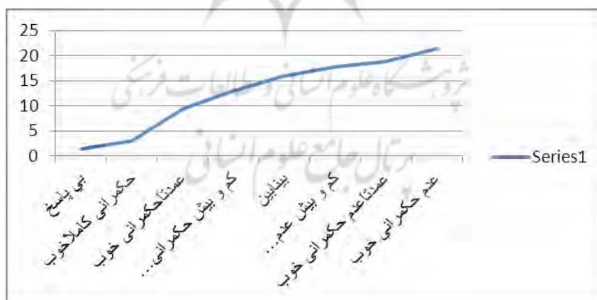
نمودار ۲. توزیع درجه‌ای کیفیت حکمرانی

براساس درجه بندی میزان عضویت در مجموعه کیفیت حکمرانی، حداکثر درجه عضویت در زیرمجموعه حکمرانی کاملاً خوب مربوط به گفتار "امنیت جانی" است. این گفتار متعلق به مؤلفه امنیت اجتماعی از بعد کارآیی دولت است. حداکثر درجه عضویت در زیرمجموعه عدم حکمرانی خوب مربوط به مؤلفه کنترل فساد مالی و اداری است که بعد کارآمدی دولت را ارزیابی می کند. حداقل درجه عضویت در زیرمجموعه عدم حکمرانی خوب مربوط به گفتارهای "ارائه خدمات شهری مانند آب، برق، تلفن و گاز"، "ایجاد مراکز بهداشت" و "درمان، ایجاد مراکز آموزشی" و مؤلفه تأمین اجتماعی است.