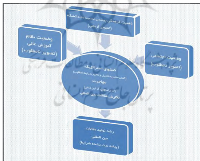
مدل ۱. انگیزش‌ها و سازوکارهای راهبردی دانشجویان تحصیلات تکمیلی در نگارش مقالات بین‌المللی

مهاجرت و اخذ بورس تحصیلی دغدغهٔ غالب دانشجویان و یگانه «برنامه» موجود ایشان برای گریز از اوضاع فعلی است. اقدام به مهاجرت تحصیلی تصمیمی است که دانشجویان برای خروج از وضع نامطلوب خود اتخاذ می‌کنند. اما برای نیل به این مطلوب در نظر دانشجویان یکی از «ضروریات» یا دست‌کم یکی از «مزیت‌های غیررقابتی» که در رسیدن به مقصد بسیار مؤثر است نگارش مقالهٔ بین‌المللی خواهد بود. در میان ۲۴ مصاحبه‌شونده، ۲۱ نفر «انگیزهٔ اصلی» خود را برای نگارش مقالهٔ بین‌المللی «مهاجرت» بیان کردند. در جمع باقی‌مانده، از میان دو نفری که تصمیمی برای مهاجرت نداشتند یک نفر «به اجبار» و فرمودهٔ استاد و دیگری برای «یادگار» می‌نوشت. انگیزهٔ شخصی آخرین نفر نیز مبهم بود. سازوکارهای تأثیرگذار بر دانشجویان به‌عنوان بخش مهمی از عوامل نگارش مقالات بین‌المللی را می‌توان الگویی ویژه در شکل‌دهی به توسعهٔ علمی به‌مثابهٔ «رشد تولید دانش» دانست (مدل ۱).