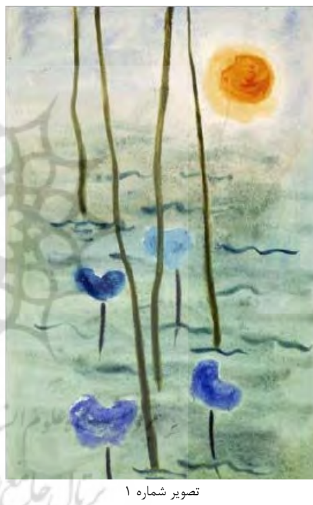
تصویر شماره ۱

خورشید، نیلوفر و دایره: این سه عنصر در فرهنگ اساطیری ایران و هند پیوندی ناگسستنی با هم یافته‌اند و هر کدام تداعی‌گر دیگری هستند؛ تا آنجا که نیلوفر را گل خورشید و دایره را نمادی از کمال خورشیدی و استکمال نیلوفری دانسته‌اند. خورشید خود منبع الهی حیات است و مظهر همه روشنگری‌ها، آفرینش، باروری، تجدید حیات و بی‌مرگی است. نیلوفر نیز که با طلوع خورشید می‌شکفتد و با غروب آن بسته می‌شود، نماد تجدید حیات به شمار می‌آید و به نوعی، نشانه کمال و کمال‌جویی است؛ زیرا برگ‌ها، گل‌ها و