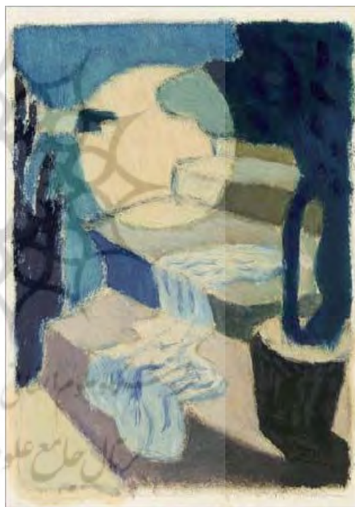
تصویر شماره ۴

زیادی از بوم را دربرگرفته و حاکی از دغدغه