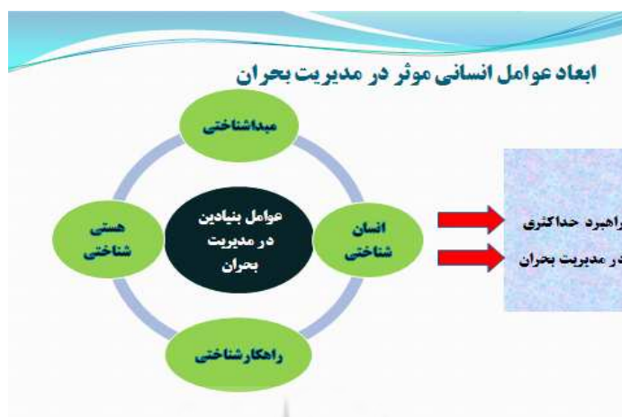
نمودار ۳. ابعاد عوامل انسانی مؤثر در مدیریت بحران