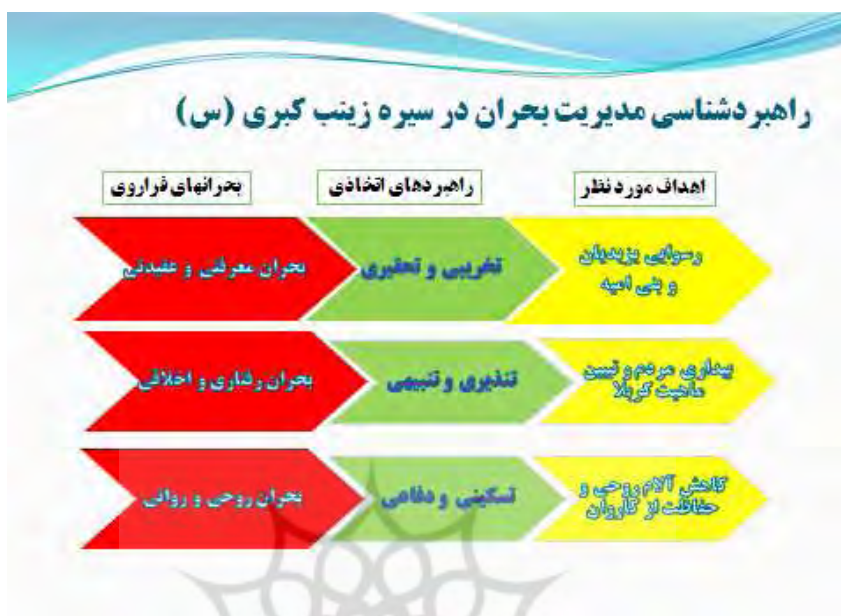
نمودار ۲. راهبردشناسی مدیریت بحران در سیره حضرت زینب (س)