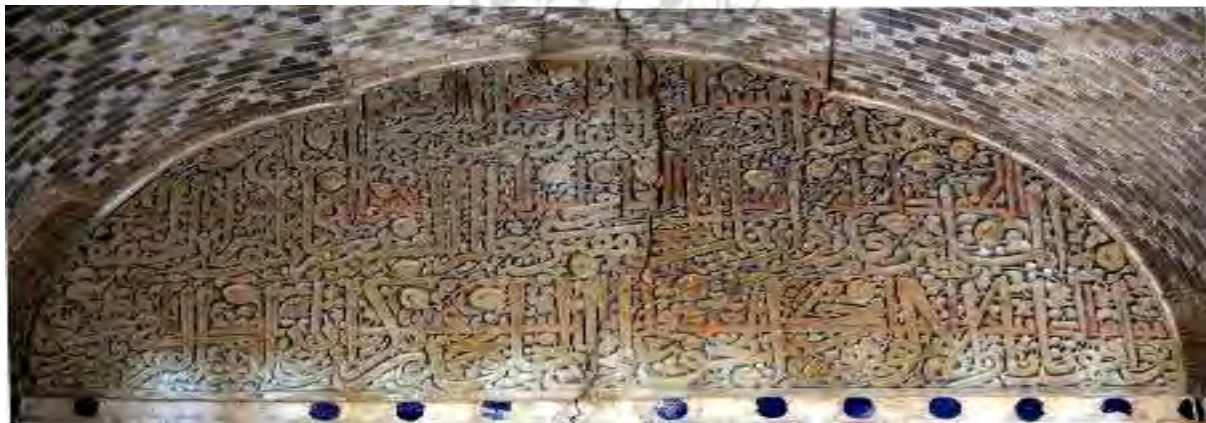
تصویر ۴: کتیبه گچی طلاکاری شده مادر و بچه به خط ثلث و کوفی، ضلع شمالی اتاق مقبره

- کتیبه حجاری وجه غربی سنگ قبر (۷۰۳ ه ق): «هذه الروضة المقدسه المبارک لشیخ المشایخ المسلمین قدوه ارباب المحققین محی معالم الشریعه مطیم معالم الطریقه کاشف اسرار الحقیقه حجه الحق علی الخلق هادی الخلق الی الحق العارف باسرار الربوبیه الواقف باثار الالوهیه محمد بن بکران جعلها الله روضه من ریاض الجنه له فی الیله الیلیا عاشر شهر ربیع الاول سنه ثلث و سبعمئه عمل سراج» (ت. ۵)