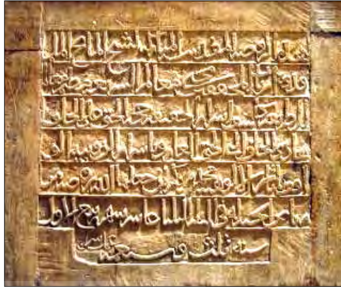
ت. ۵: کتیبه حجاری وجه غربی سنگ قبر، ۷۰۳ ه.ق