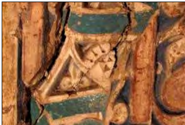
ت. ۱۲: آرایه‌های گچی زمینه کتیبه کاشی کاری

روی تزئینات گچی شواهدی از رنگ آبی به چشم می‌خورد. (ت. ۱۲) ایرانیان در فن استفاده از خط به‌عنوان هنر برای کاربرد در تزئین بناها، اضافه بر کتابت، نقوش دیگری از گیاهان را نیز به‌کار می‌برند (یاوری، ۱۳۹۰: ۷۴).