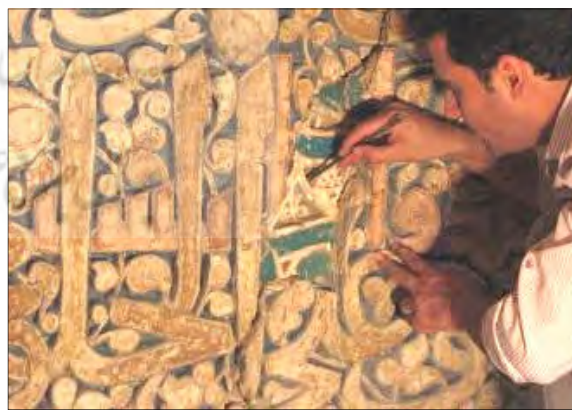
تصویر ۱۰: نمایان شدن بخشی از کتیبه کاشی معرق