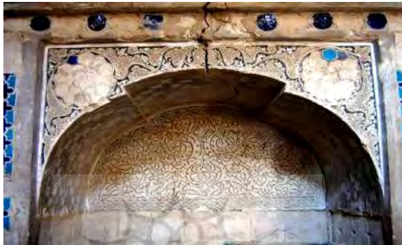
تصویر ۷: آرایه‌های ضلع شمالی اتاق مقبره

دیواره‌های اطراف آن - وجوه شمالی، شرقی و غربی - از کاشی معقلی با طرح هشت و چلیپای فیروزه ای و لاجورد پوشیده شده است. در ارتفاع ۱۰۳ سانتی متری از کف آثاری از ۱۵ عدد کاشی خشتی مربع شکل به ابعاد حدودی ۲۴ در ۲۴ سانتی متر بر ملات گچ دیده می‌شود که متأسفانه در حال حاضر اثری از آن‌ها نیست. تمامی سطح زیر قوس کلیل در این بخش از لبه کاشی‌های مربع شکل تا نوک قوس با آرایه توپی ته‌آجری (نقوش مهری) تزئین یافته است. کلمه محمد طرح کلی نقوش مهری مورد استفاده در این بخش می‌باشد. سطح نقوش مهری را با رنگ سفید رنگ‌آمیزی کرده‌اند (ت. ۷).