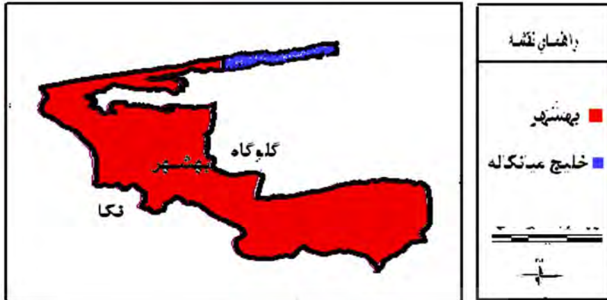
شکل ۱ تقسیمات سیاسی بهشهر