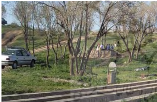
شکل ۳: پارک جنگلی