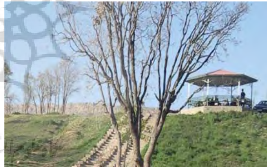
شکل ۴: پارک جنگلی

فلومیس، گل گاوزبان، شیرین بیان، کاهو وحشی، گل گنده، ختمی، پوآ، نوآ، شقایق، بابونه و ... است. حیوانات و جانوران که انواع قابل ذکر آن شامل: گرگ، جوجه تیغی، خرگوش، روباه، شغال، گراز، موش، مار، آفتاب‌پرست، لاک‌پشت، کلاغ، کبک، تیهو، لاش‌خور، دارکوب و ... است. اقلیم پارک بر اساس طبقه‌بندی آمبرژه نیمه‌مرطوب سرد است.