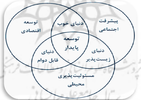
شکل ۱. معنای مفهومی توسعه پایدار از تلفیق مسائل اقتصادی، اجتماعی و محیطی

برای اینکه توسعه پایدار برقرار گردد، باید فاکتورهای اجتماعی و اکولوژی و اقتصادی را در منابع زنده و غیر زنده و فعالیت‌های مختلف (چه استفاده کوتاه‌مدت و یا بلندمدت و یا عدم استفاده) را در نظر داشت. سه پیش شرطی که در رابطه با سیاست‌های توسعه در نظر گرفته شده است عبارتند از: حفظ جریانات اکولوژی، استفاده از منابع و حفظ تنوع ژنتیکی. پایداری برنامه-های مدیریت مشارکتی حوزه‌های آبخیز را می‌توان با محوریت سه نشانگر اساسی مورد بررسی قرار داد که این سه نشانگر عبارتند از نشانگر اجتماعی و فرهنگی، نشانگر اقتصادی و نشانگر محیط‌زیستی و اکولوژیکی (دستورالعمل پایش و ارزشیابی طرح‌های مدیریت منابع طبیعی و آبخیزداری، ۱۳۸۸، ص ۱۴۲). مفهوم شکل ۱ این است که محل تلاقی یا همپوشی این سه قلمرو نشان‌دهنده پایداری است. لیکن، به هنگام به اجرا در آوردن این ایده شماتیک مشکلات مفهومی قابل ملاحظه‌ای ظاهر می‌شود.