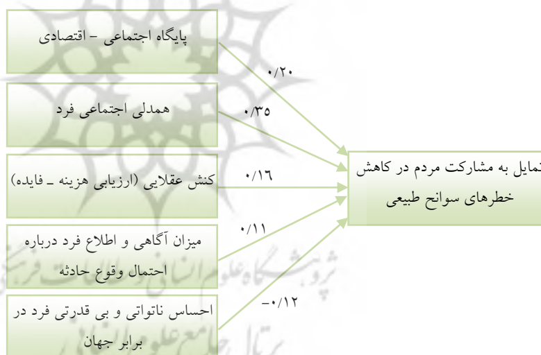
شکل (۲): مدل رگرسیونی عوامل مؤثر بر تمایل به مشارکت در کاهش خطرپذیری سوانح طبیعی

سطح معنی داری تأثیر نسبی حضور هر متغیر مستقل در مدل p=