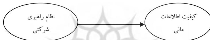
شکل شماره ۱: الگوی علی پارامترهای پژوهش

ضمن، بین متغیرهای کنترلی (اندازه موسسه حسابرسی، اندازه شرکت و سن شرکت) و کیفیت اطلاعات مالی نیز ارتباطی وجود ندارد. به نظر می‌رسد شاید دلیل رد فرضیه‌های پژوهش مذکور استفاده از الگوهایی است که به جای اندازه‌گیری مستقیم کیفیت اطلاعات مالی، بیشتر جنبه کیفیت سود و اقلام تعهدی را مورد بررسی قرار می‌دهند. همانطور که ذکر شد، فتی (۲۰۱۳) نیز تنها از کیفیت اقلام تعهدی برای اندازه‌گیری کیفیت اطلاعات مالی استفاده نموده است. لذا، در پژوهش حاضر از ویژگی‌های کیفی اطلاعات مطرح شده در چارچوب نظری گزارشگری مالی که مورد استناد بیشتر مجامع حرفه‌ای است، استفاده گردیده است (شکل شماره ۱).