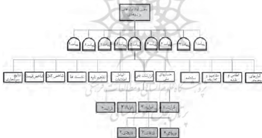
شکل (۳): درخت سلسله‌مراتب

همچنین سیزده فرایند و هفت دسته ورودی برای مرکز آمار در این نقشه شناسایی شده است. پس از یکپارچه کردن نقشه شناختی خبرگان، از فن فرایند تحلیل سلسله‌مراتبی برای انجام مقایسه‌های زوجی و رتبه‌بندی فعالیت‌های مرکز به لحاظ تخصیص بودجه استفاده شد. درخت سلسله‌مراتب بر اساس نقشه شناخت نهایی، متشکل از چهار سطح پیامدها، خروجی‌ها، فرایندها و ورودی‌ها بود.