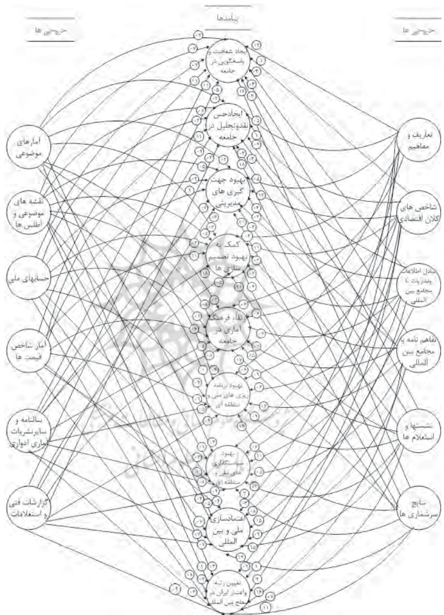
شکل (۶): بخش سوم مدل بودجه‌ریزی عملیاتی مرکز آمار ایران