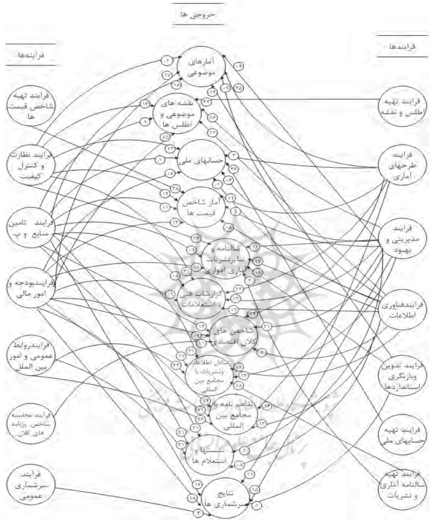
شکل (۵): بخش دوم مدل بودجه‌ریزی عملیاتی مرکز آمار ایران

بخش دوم مدل فرایندهای دخیل در تولید هر خروجی معین و سهم هر فرایند از بودجه خروجی مذکور را نشان می‌دهد.