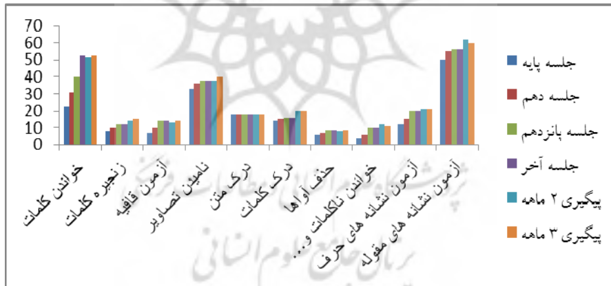
نمودار ۴ نمرات آزمودنی دوم از گروه فرنالد در آزمون نما در جلسات پایه، درمان و پیگیری

همان‌طور که در نمودارهای ۳ و ۴ نشان داده شده است آزمودنی‌های گروه فرنالد در اکثر خرده‌آزمون‌های درصد بهبودی بالایی نشان می‌دهند؛ این به معنی اثربخشی روش چندحسی فرنالد است