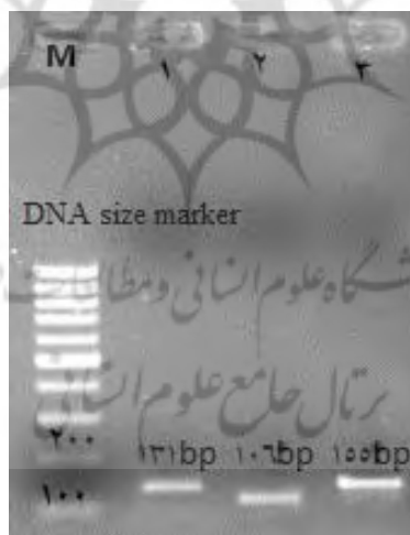
شکل ۱ - بررسی تکثیر ژن با روش PCR و الکتروفورز با ژل آگارز (۱ درصد) در نمونه هموژن عضله، ستون ۱: \beta -actin، ستون ۲: MGF و ستون ۳: IGF-1