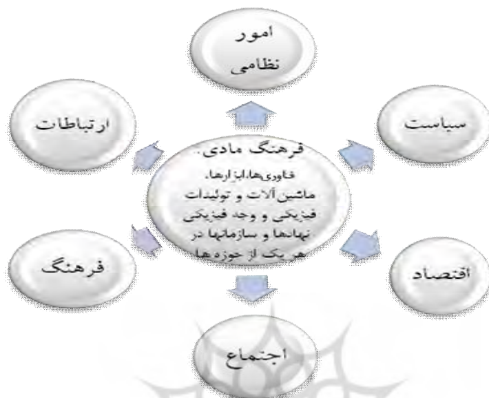
شکل ۲- الگوی مفهومی و برجسته‌ترین مؤلفه‌های آن