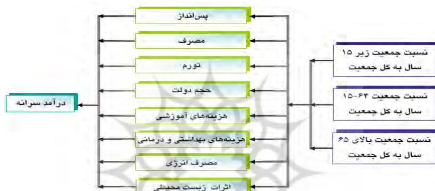
نمودار ۲- کانال‌های اثرگذاری ساختار جمعیت بر درآمد سرانه

با توجه به ادبیات موضوع، کانال‌های مختلف اثرگذاری ساختار سنی جمعیت بر رشد اقتصادی و درآمد سرانه، مطابق نمودار ۲ مورد شناسایی قرار گرفته و در ادامه، به بررسی رابطه علیت بین رشد (افزایش) نسبت جمعیت در هریک از گروه‌های سنی سه‌گانه و هریک از این کانال‌ها پرداخته و سپس رابطه علیت بین هریک از این کانال‌ها و درآمد سرانه را مورد بررسی قرار می‌دهیم.