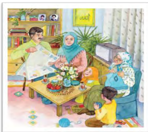
شکل ۲- مربوط به کشور ایران