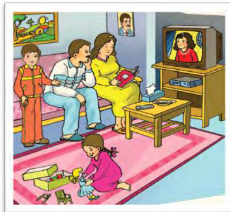
شکل ۱- مربوط به کشور سوریه

افراد فرهنگ رسمی را به خاطر قدرتی که در ورای آن کمین کرده است، می‌پذیرند، ولی آن را به درستی درونی نمی‌کنند و در عوض، به جای آن فرهنگ غیررسمی را که با ارزش‌ها و نگرش‌های خانوادگی آنها همسوست، درونی می‌کنند و این تناقضی است که ما درون جامعه می‌بینیم و از همین مسأله ناشی می‌شود، زیرا افراد پیام‌هایی را که به آنها منتقل می‌شود، به شیوه‌های مختلف رمزگشایی می‌کنند.