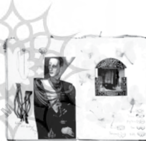
1/2 Examples of analytical drawing taking place in a research book.