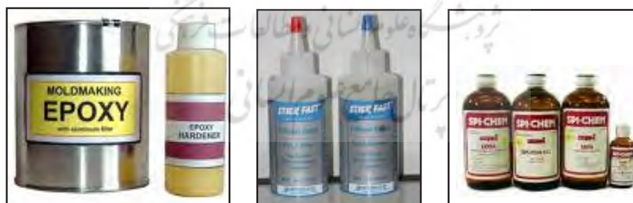
تصویر ۱۲ - فرم های مختلف تجاری اپوکسی

EP سخت و شفاف بوده و اغلب رنگ زرد پریده ای ایجاد می کند و در کتون ها، استرها، آروماتیک ها و هیدروکربن های کلره محلول اند. البته انواع دارای پیوندهای عرضی زیاد در برابر حلال های آلی مقاوم می باشند. (Schniewind, 2001, p 480) اپوکسی در فرمول چسب ترموپلاستیک می باشد و در ضمن چسباندن به ترموست تبدیل می شوند. (باقری، صص ۳۰)