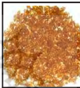
تصویر ۱ - دانه های سریشم ماهی

این چسب ها مقاومت رطوبتی پایینی داشته و به دلیل استفاده از آب به عنوان حلال موجب واکنشیدگی چوب می گردند. از طرف دیگر پس از خشک شدن همکشیدگی زیادی ایجاد کرده، ترد و شکننده شده و باعث ایجاد تنش می گردند. تغییر در طول زمان، لزوم استفاده از آفت کش ها و ایجاد تیرگی در چوب مورد درمان از دیگر معایب آنها می باشد. (Schniewind, 2001, pp378-381) در بعضی موارد یک عامل سخت کننده (عامل پخت) جهت تشکیل اتصال عرضی (مانند پارافرمالدئید یا هگزامتیلن تترامین) را به محلول چسب اضافه می کنند. در این حالت چسب با اعمال حرارت و در pH معادل چهار و نیم تا پنج پخت می شود. (باقری، صص ۶۳ - ۶۲) البته این امر استفاده از آن را محدود وی کند. در این میان هزینه های پایین، در دسترس بودن و سهولت کار از جمله محاسن استفاده از این مواد می باشد. با توجه به این موارد اصلاح فرمولاسیون در جهت کاهش موارد منفی استفاده موضوعی است که نیازمند تحقیقات جدی می باشد.