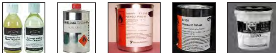
BMX ۵۵۰، سولاکریل P ۲۶، پلکسی سول P ۶۷، پلکسی گام B تصویر ۱۰ - از راست به چپ: دو مورد اول پارالوید (apps.webcreate.com& www.paret.jp& www.productosdeconservacion.com& kremer-pigmente.de& krustashop.cscstavby.cz)

مخلوط پارالوید B67 با اپوکسی علاوه بر برگشت پذیری، استحکام بالایی را هنگام پوشش دهی ایجاد می کند (Ellis, 2002) PBMA در معرض تاثیر طولانی مدت نور دچار اتصالات عرضی می گردد و خواص انحلالی آن تغییر می کند ولی در زمانی که دمای تبدیل شیشه ای پایین، وزن مولکولی کم و انحلال بهتر مد نظر باشد از PBMA استفاده می گردد. (هوری، صص ۱۱۸ - ۱۱۶)