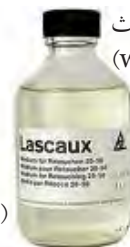
تصویر ۲ - موولیت (www.paret.jp)