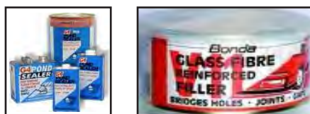
تصویر ۱۱ - پلی استر در فرم بونداگلاس