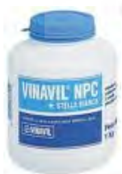
تصویر ۳ - ویناویل (www.bricoservice.it& www.colourz.it)