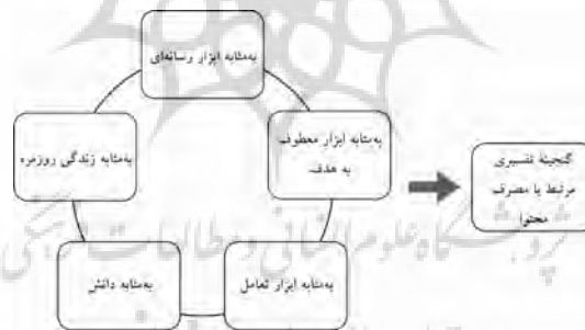
نمودار ۳. نمودار گنجینه تفسیری مرتبط با مصرف محتوا

نخست باید توجه کرد که مفهوم «ابزار»، مهم‌ترین سازه معنایی و ذهنی دانشجویان در پاسخ به پرسش‌های مرتبط با گنجینه تفسیری مرتبط با مصرف محتوا در اینترنت بوده است. در پاسخ به پرسش‌هایی مانند «اینترنت برای تو چه معنایی دارد؟» یا «اینترنت به نظرت چیست؟»، دانشجویان عموماً روایت‌های خود را این گونه آغاز می‌کردند: «وسیله‌ای است که...»، «ابزاری است که...»، «دستگاهی است که...» یا حتی «ماشینی است که...». این موضوع زمانی دلالت‌مند می‌شود که آن را با مفاهیم دیگری چون «رسانه»، «تکنولوژی»، «فرهنگ» یا «هنر» و «زبان» مقایسه کنیم. به عبارت دیگر، گنجینه‌های تفسیری دانشجویان، اینترنت را در دسته ابزارهای تکنولوژیک همچون «اتومبیل»، «مودم»، «لپ‌تاپ» یا «ماشین لباس‌شویی» قرار می‌دهد و برای آن ماهیتی تکنولوژیک فرض می‌کند. بنابراین، در اینجا نیز می‌توان مصادیقی از پیش‌فرض‌های عام فرهنگی ایرانیان درباره تکنولوژی را مشاهده کرد. همان‌گونه که نیما ادامه می‌دهد: «وسیله‌ای است که می‌توان با آن همه کار کرد، خوب یا بد!» در نمودار (۳) مهم‌ترین مفاهیم مرتبط با گنجینه تفسیری مصرف اینترنت ارائه شده است.