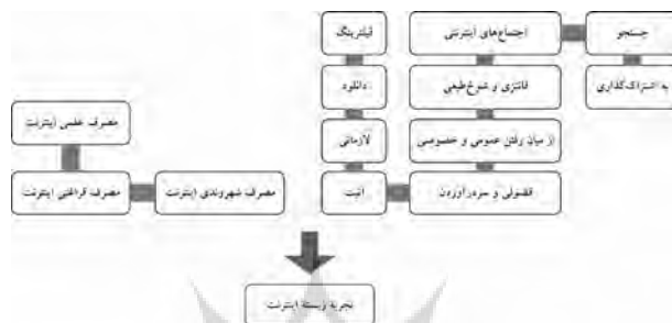
نمودار ۴. نمودار مرتبط با مفاهیم تجربه زیسته اینترنت

❖ تجربه‌های زیسته در این سه دسته نوعی رابطه دال و مدلولی است که در آن تلاش شده است تا از طریق نوعی دلالت بخشی به فعالیت‌ها، مدلول‌های مصرف شود. بنابراین دسترسی به تجربه‌های زیسته مرتبط با مصرف اساساً در خلال فرایند کدگذاری باز و سپس تفسیر آنها شکل گرفته است. افزون بر این، پاره‌ای از تجربه‌های دیگر نیز گزارش شده است که الزاماً در مفاهیم مرتبط با مصرف جای نمی‌گیرد. مجموعه این مفاهیم در نمودار (۴) گزیده شده است.