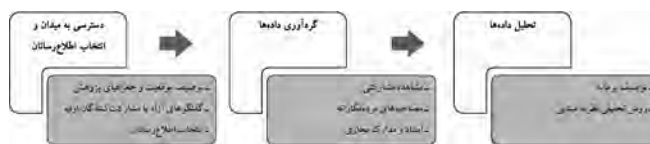
نمودار ۱. مراحل عملی پژوهش

در مرحله انتخاب اطلاع‌رسانان، مجموعه‌ای از گزینش‌ها و معیارها برای دسترسی و انتخاب اطلاع‌رسانان صورت گرفته است. در جدول (۱) به مهم‌ترین راهبردهای نمونه‌گیری و انتخاب اطلاع‌رسانان این نوشتار اشاره شده است: