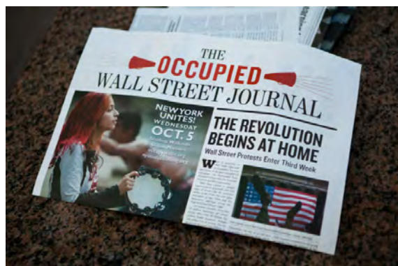
تصویر ۵. نمونه‌ای از روزنامه‌های چاپ شده توسط فعالان جنبش اشغال والاستریت