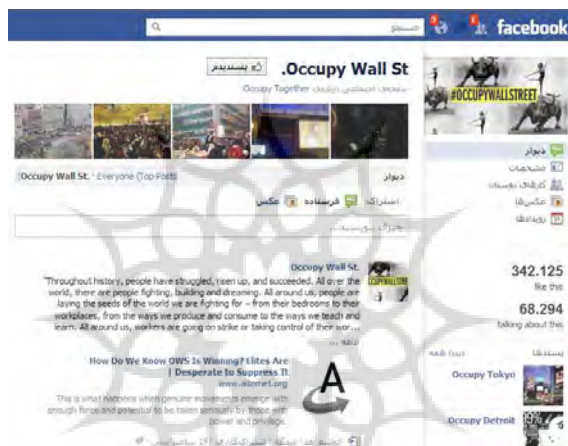
تصویر ۴. بزرگ‌ترین صفحه حامیان فیس‌بوکی جنبش وال استریت

در اول اکتبر «بوستون را اشغال کنید» در توییتر نمایان شد؛ پس از ۲ هفته «دنور را اشغال کنید» و «داکوتای جنوبی را اشغال کنید» و ... در صفحه اینترنت ظاهر شدند (همان). صفحه «وال استریت را اشغال کنید» فیس‌بوک (تصویر ۴) نیز در ۱۹ سپتامبر به همراه فیلم‌های معترضان اولیه در یوتیوب به عرصه اینترنت پا گذاشت. این صفحه هم‌اکنون بیش از ۳۴۰ هزار عضو دارد که از این میان تنها حدود ۷۰ هزار نفر در گفتگوها فعال هستند. از سوی دیگر علاوه بر آمریکا اکنون صفحات فیس‌بوک برای اشغال کشورها یا شهرهایی از کشورهای کانادا، دانمارک، پرتغال، ایتالیا، بریتانیا، سوئد، فرانسه، آلمان، اسپانیا، کلمبیا، استرالیا و ... نیز راه‌اندازی شده است.