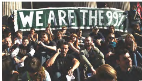
تصویر ۱. شعار اصلی فعالان جنبش اشغال وال‌استریت

«والاستریت را اشغال کن» را یک جنبش اجتماعی نام‌گذاری کرد (dcourier, 2011).